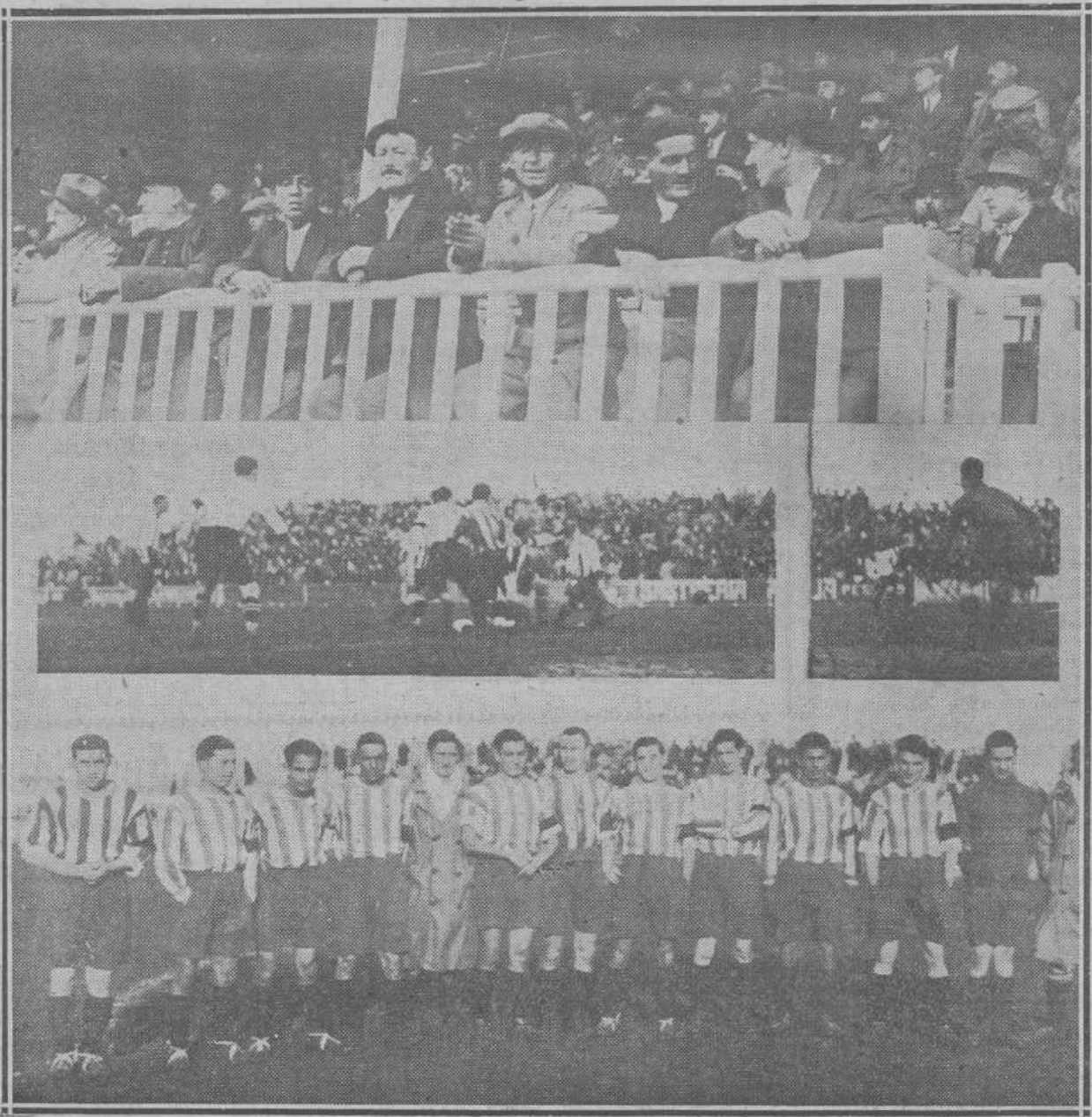
Algunos de los salvadores de los tripulantes del «Pepín» presenciando el partido del domingo en los Campos de Sport.-Un momento del encuentro.-Equipo presentado por el Real Sporting de Gijón.

Todos sabemos que los gloriosos antepasados de nuestros activos y felices vecinos ganaron para éstos los fueros que les permiten tener todos los derechos de los demás españoles sin que les alcancen sus grandes ventajas, con lo que hemos de conseguir que en materia comercial los protejamos por el eje.