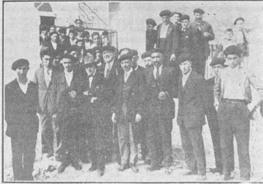
Los obreros al salir del mitin verificado con motivo de la inauguración de la Casa del Pueblo en Nueva Montaña.

rechos que en la humanidad les corresponde. Termina invitando a todos a la unión honrada y noble, para hacerse cada día más fuertes y poder combatir contra el inexpugnable baluarte de las circunstancias.