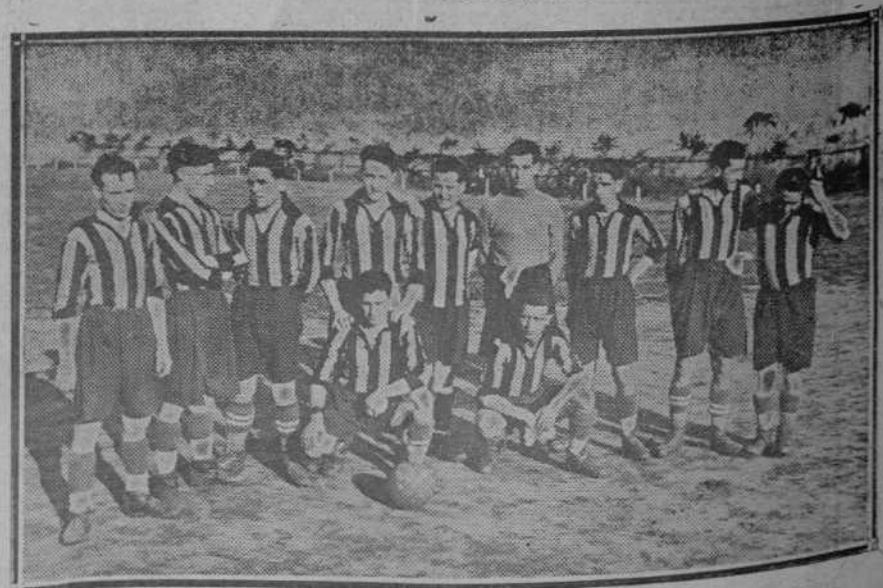
Equipo del Unión Club de Astillero, que el domingo empató a cero con el Guarnizo.