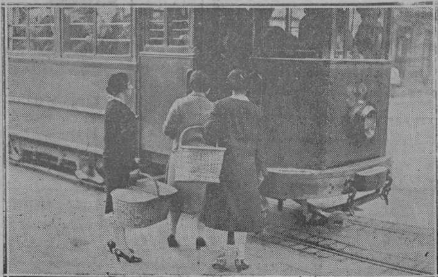
Situarse en una plataforma, que es su lugar preferido...