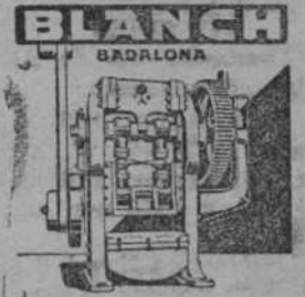
PRENSA EXCENTRICA Y OTRAS MAQUINAS PARA TRABAJAR ARTICULOS DE CHAPA Y PARA FABRICAR ENVASES DE HOJALATA

Hora es ya de que este asunto se zanje definitivamente, y en ninguna ocasión mejor que en esta, en que el Sindicato tiene pendiente una reclamación hecha a la patronal, pues sería un medio de que estas cuestiones empezaran a resolverse por los Comités.