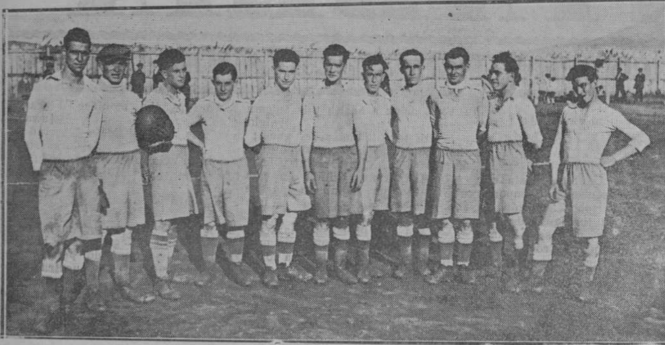
El equipo del Guarnizo que empató con el Unión Club.