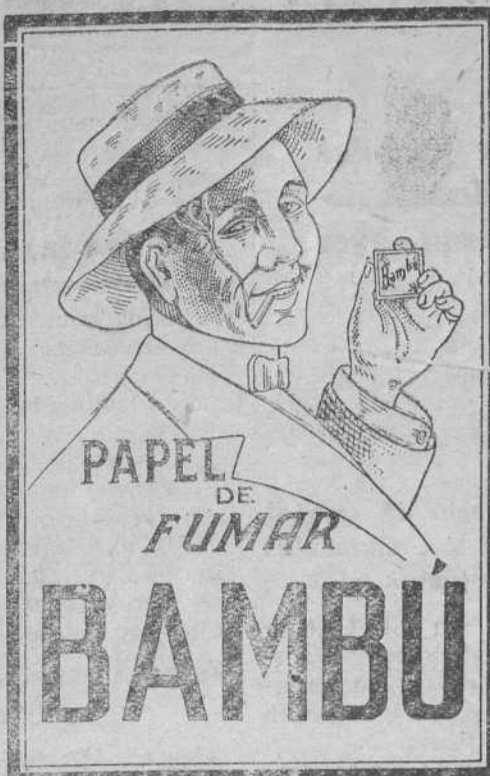
Ha obtenido GRAN PREMIO en la Exposición de Barcelona de 1930

OFICINAS: General Espartero, 5. GARAGE CENTRAL. Teléfonos 2639-2829