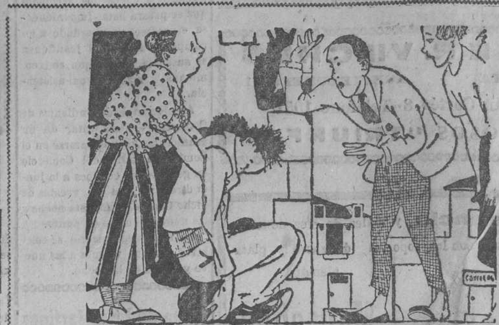
DESPUES DEL SUCESO

Y, si como esperamos, la revolución comenzada por Calles, sale triunfante de esta nueva prueba, Méjico se habrá librado para siempre de los garras y llevaron al caos de las asonadas militaristas a plazo fijo.