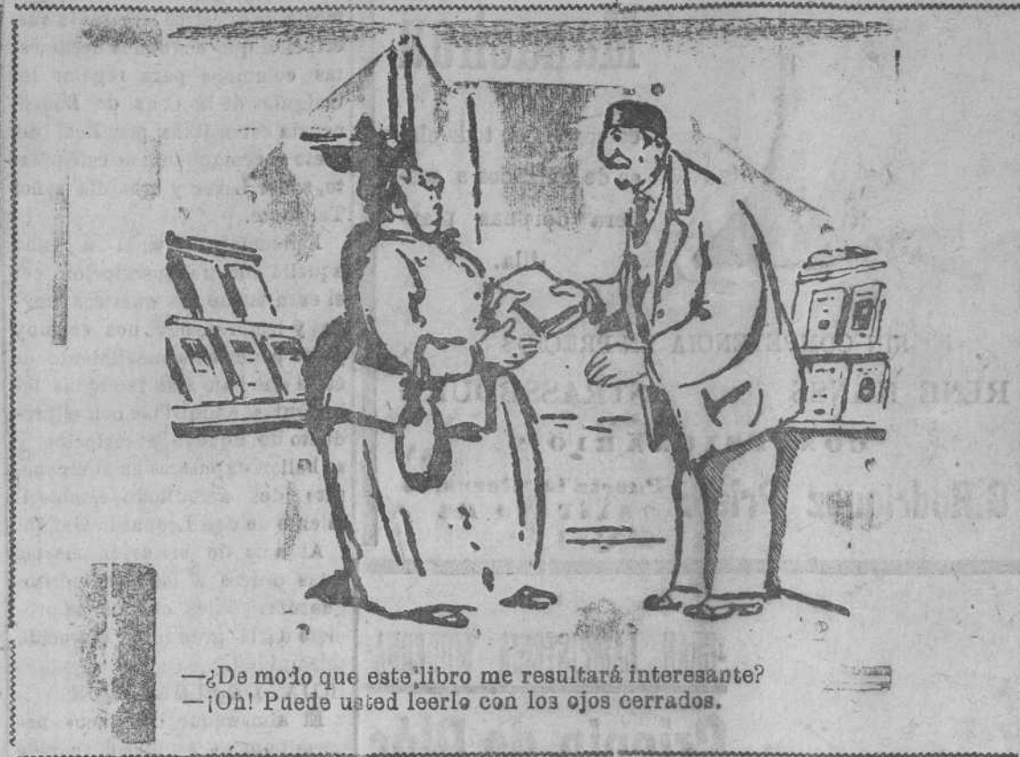
—¿De modo que este libro me resultará interesante? —¡Oh! Puede usted leerle con los ojos cerrados.

Pudo vivir bien y tranquilo como viven otros camaradas todos, y prefirió sacrificio todo a la idea que inquietaba su corazón y movía su pluma en defensa de los desvalidos. Fué un ser excepcional. Torralba no ha debido de morir. No ha muerto. Su espíritu y su ejemplo magnífico y sublime, tendrá desde hoy el calor de nuestro corazón y la fuerza de nuestra voluntad para emularle.