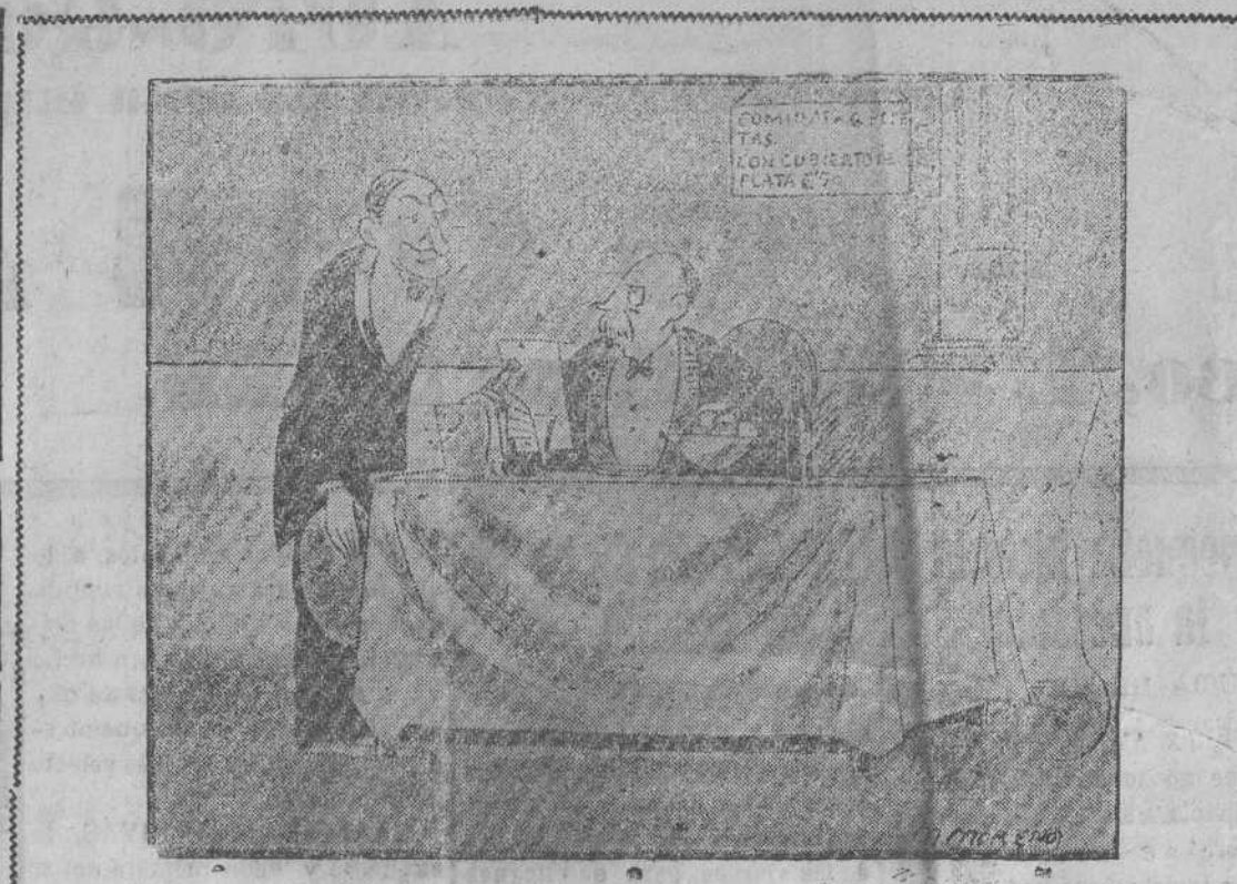
EN EL RESTAURANT

Sesión extraordinaria del día 11. Resolución del delegado de Hacienda en el presupuesto para el año 1929.