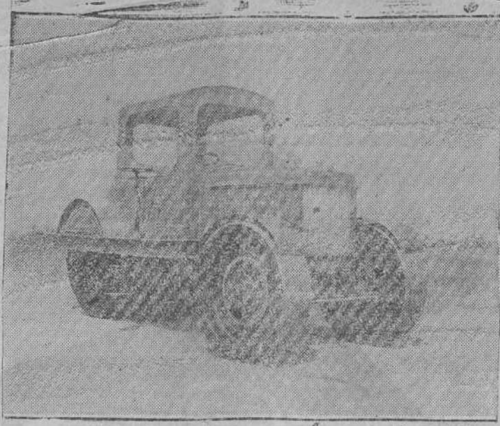
Apisonadora con motor de gasolina

de desenvolver sus industrias, equivale a matar la población. Es asunto éste el del dragado algo difícil de tratar porque no siempre se favorecen intereses tratándole serenamente como yo lo hago.