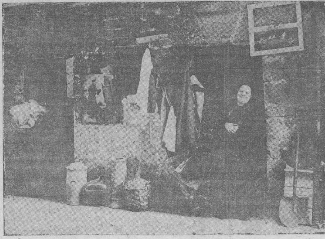
Uno de los santanderinos y típicos bazares del pobre.