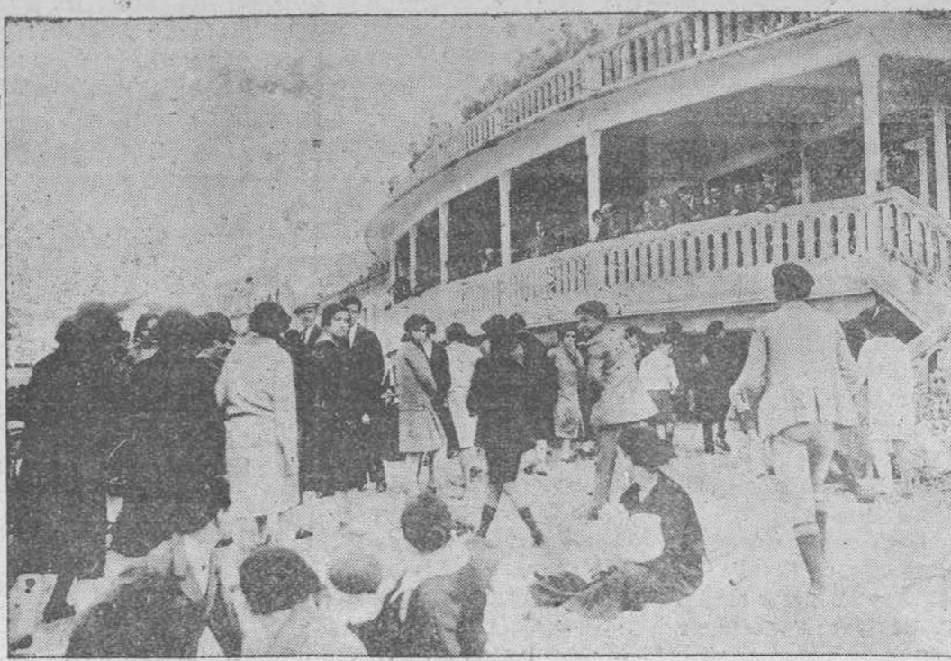
La animación en la Playa del Sardinero, el día de la Fiesta del Trabajo

Seguidamente se da lectura de las conclusiones que se ele-