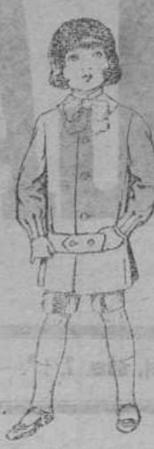
TRAJE MODELO CASACA para niños 4 PESETAS 12