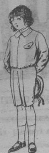
Trajes lanilla y dril, para niños de cuatro á diez años, de PTAS. 4 á 35