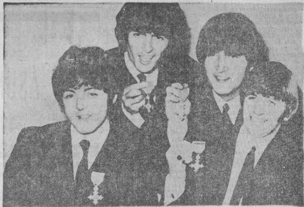
Los Beatles en la cúspide de su fama, cuando aún defendían su gran sueño.