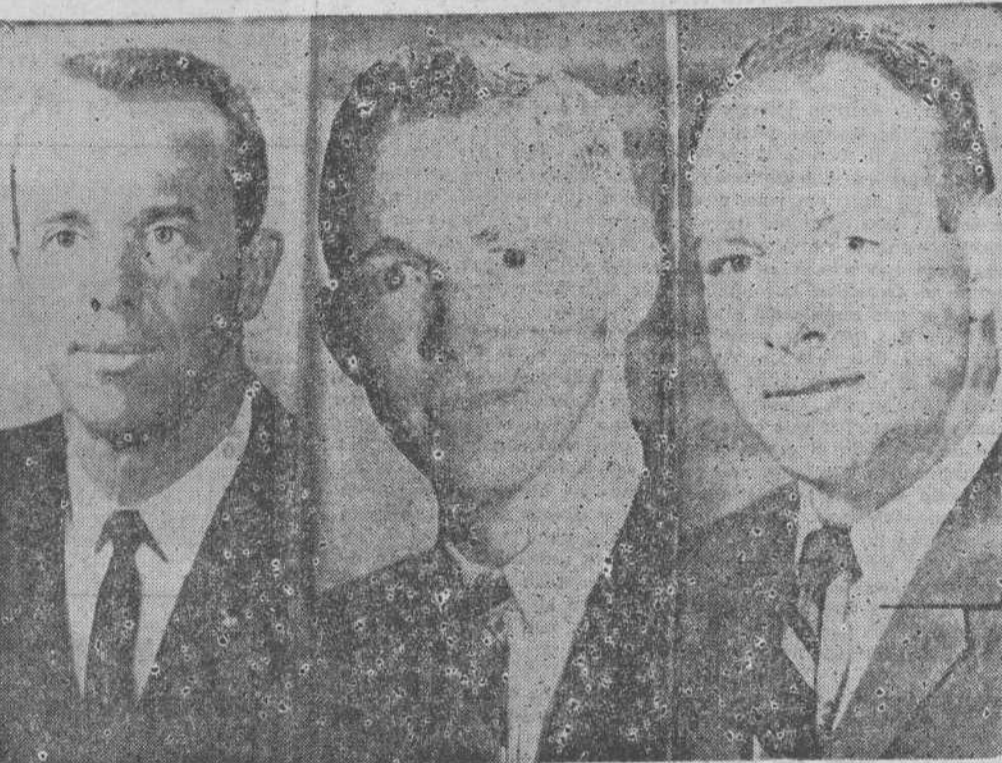
Los tripulantes del «Apolo 14»: de izquierda a derecha, Alan B. Shepard, comandante de la nave; Stuar A. Roosa, piloto del módulo de mando, y Edgard D. Mitchell, piloto del módulo lunar.

combustible, había caído sobre las aguas del Atlántico y el combustible de la segunda de las tres fases estaba a punto de agotarse.