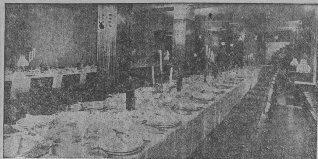
SALON DE FIESTAS OROSTATUS