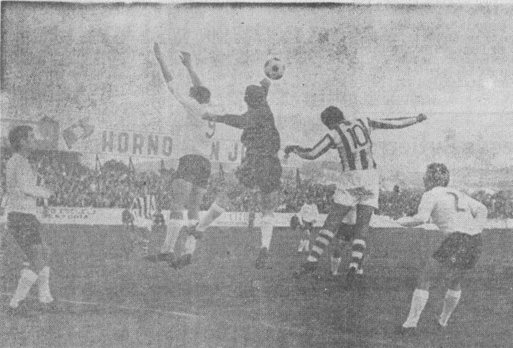
El portero del Hullera despeja de puño un balón que intentaba rematar Mundo.

una parcela excesivamente reducida para sus facultades. Lo mejor, por tanto, de este aburrido partido que comentamos, ha sido el resultado, y también, la lección que de él puede sacarse. LOS GOLES A los 30 minutos del primer tiempo, Irizar, en un rechace de la defensa forastera, dispara fortísimo desde fuera del área y bate por la escuadra a José. Cuando se jugaba el minuto 40 de la segunda mitad, Arce marca el segundo gol. ARBITRO El árbitro, señor Cabrero, estuvo a tono con el partido. Pitó repetidas faltas dentro del área, cuando las entradas no merecían tanto rigor. En este aspecto perjudicó, principalmente, al Hullera. Su paso por el Malecón no ha dejado un grato recuerdo entre los espectadores. ALINEACIONES: Gimnástica: Cazalla; Echevarría, Susi, Gofii; Irizar, Bustamante; Viti, López, Arce, Mundo y Antonio. En el segundo periodo, Badiola substituyó a Antonio y cuando ya finalizaba la confrontación, Nenito entró por López. Hullera: José; Esteban, Alonso, Linter; Riesco, Toño; Martínez, Villanueva, Julián, Santi y Manolin. En el minuto 5 se lesionó fortuitamente Linter, entrando en su lugar Iván. ECHAVE