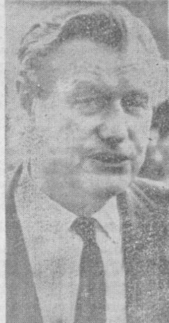
El gobernador de Nueva York, Nelson Rockefeller.

Washington. (Efe-UPI).—El gobernador Nelson Rockefeller ha recomendado al presidente Nixon que los Estados Unidos aumenten su ayuda militar a Fuerzas de Seguridad locales en Iberoamérica, según ha sido confirmado por la Casa Blanca. La recomendación forma parte de un largo informe preparado por Rockefeller durante una serie de viajes por Hispanoamérica en la pasada primavera, como enviado especial del presidente Nixon. El presidente Nixon facilitará al público detalles completos sobre el informe, en el curso de