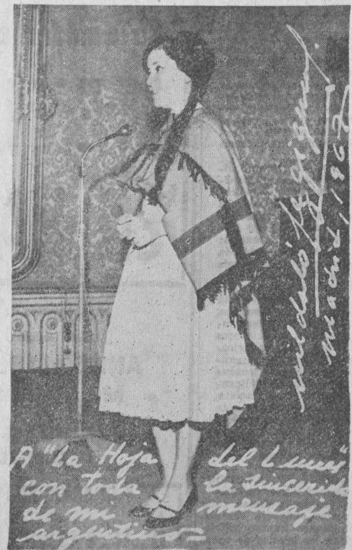
ido por ciudades y pueblos rogando a las gentes sencillas que recitaran ante mi magnetofono estos poemas.

—¿Quiere explicarnos qué es eso del "acento"? —He recopilado gran cantidad de poemas, digamos folklóricos. Después me he