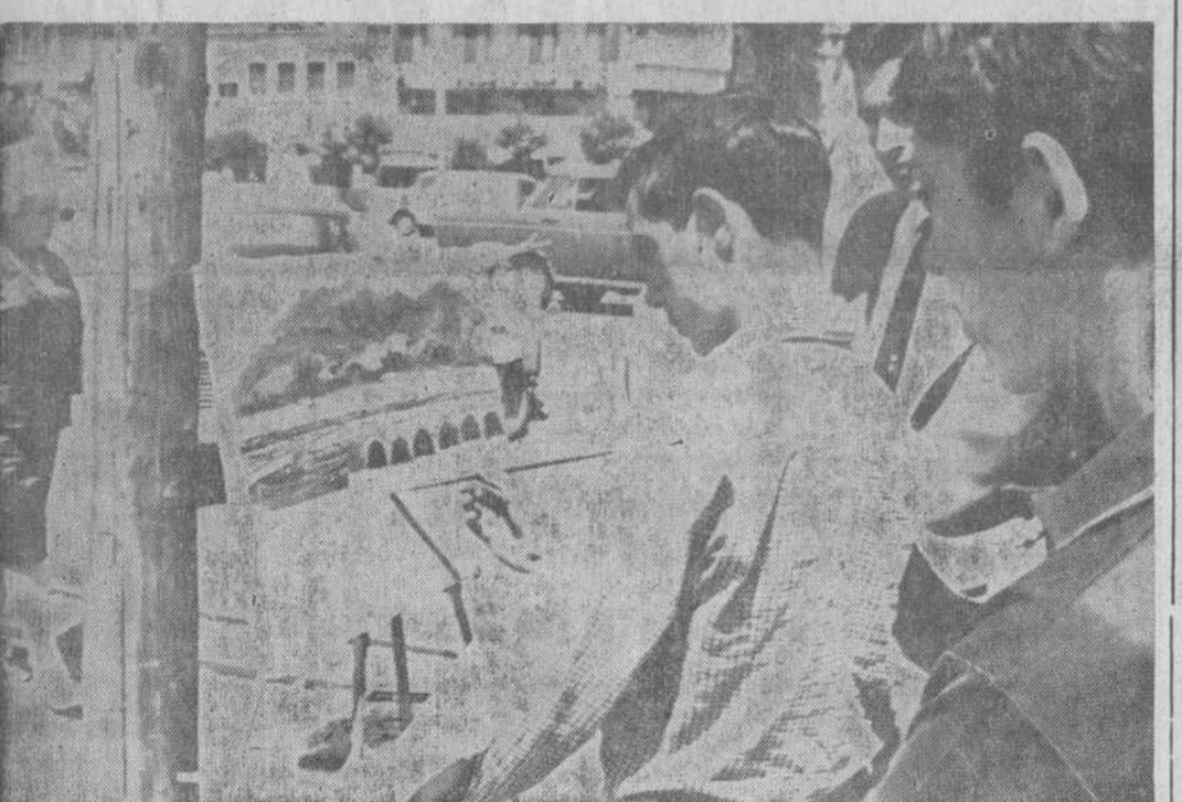
Organizado por la Sociedad «Amigos del Arte», ayer se celebró el concurso de pintura para jóvenes, al aire libre. Nuestro reportero gráfico captó aquí a uno de los pequeños artistas dando los últimos retoques a su obra.