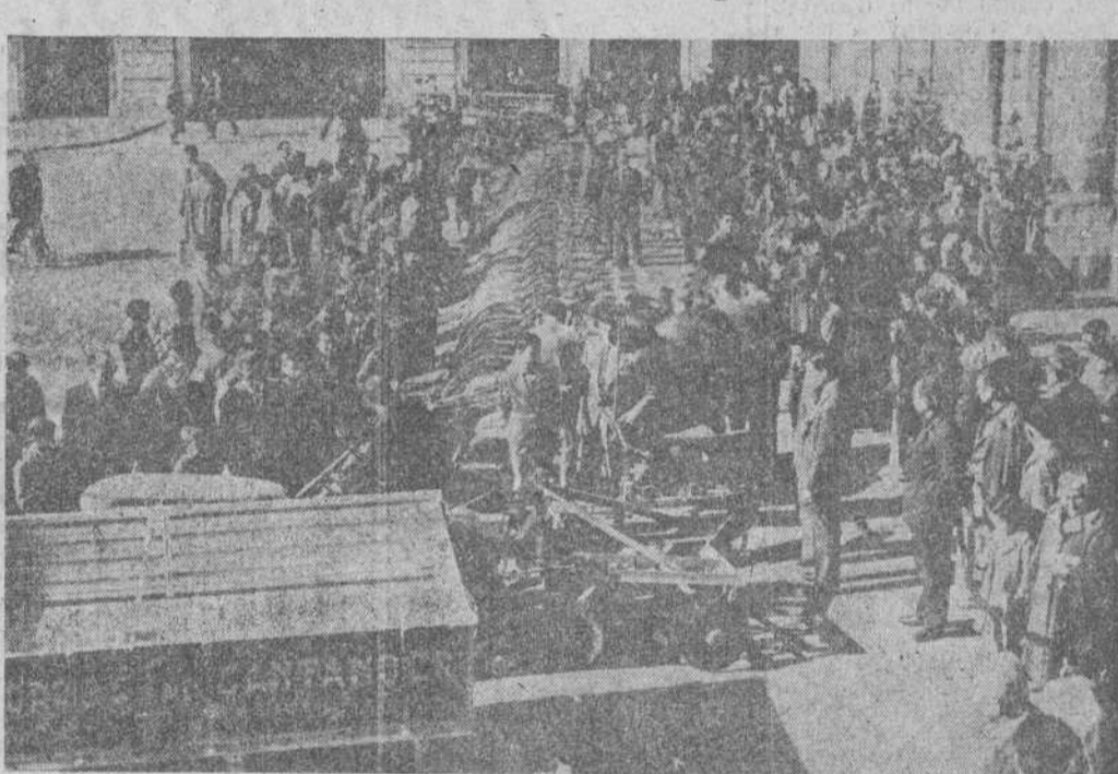
Un aspecto de la Plaza de Velarde en la mañana de ayer, durante la exposición de las treinta motosegadoras, tractores y otro material agrícola, adquirido por la Caja de Ahorros de Santander para los labradores de la provincia. (INFORMACION EN OCTAVA PAGINA)