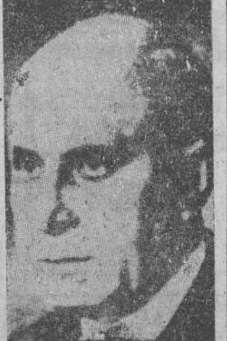
Américo Thomas, Presidente de Portugal.

Su Santidad imparte su bendición a España Ciudad del Vaticano.—Su Santidad Juan XXIII ha impartido su bendición a España después de ofrecer una misa para 120 estudiantes del Colegio Pontificio Español de Roma. La ceremonia religiosa se celebró en la capilla de Santa Matilde, del Palacio vaticano, en la que el Padre Santo exhortó a los estudiantes a servir a la verdad y practicar la caridad. Los superiores del Colegio presentaron a Su Santidad a cada uno de los estudiantes.