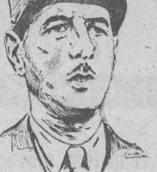
DE GAULLE, Presidente de Francia.

Varios muertos a causa de actos de terrorismo en Argelia