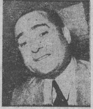
ADNAN MENDERES, primer ministro turco.

Nuevo acuerdo de amistad entre los dos países