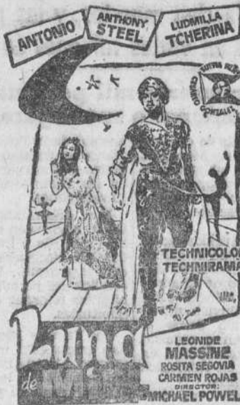
Autorizada para mayores de 16 años.

¡Una de las películas más costosas y extraordinarias realizadas en los últimos años!