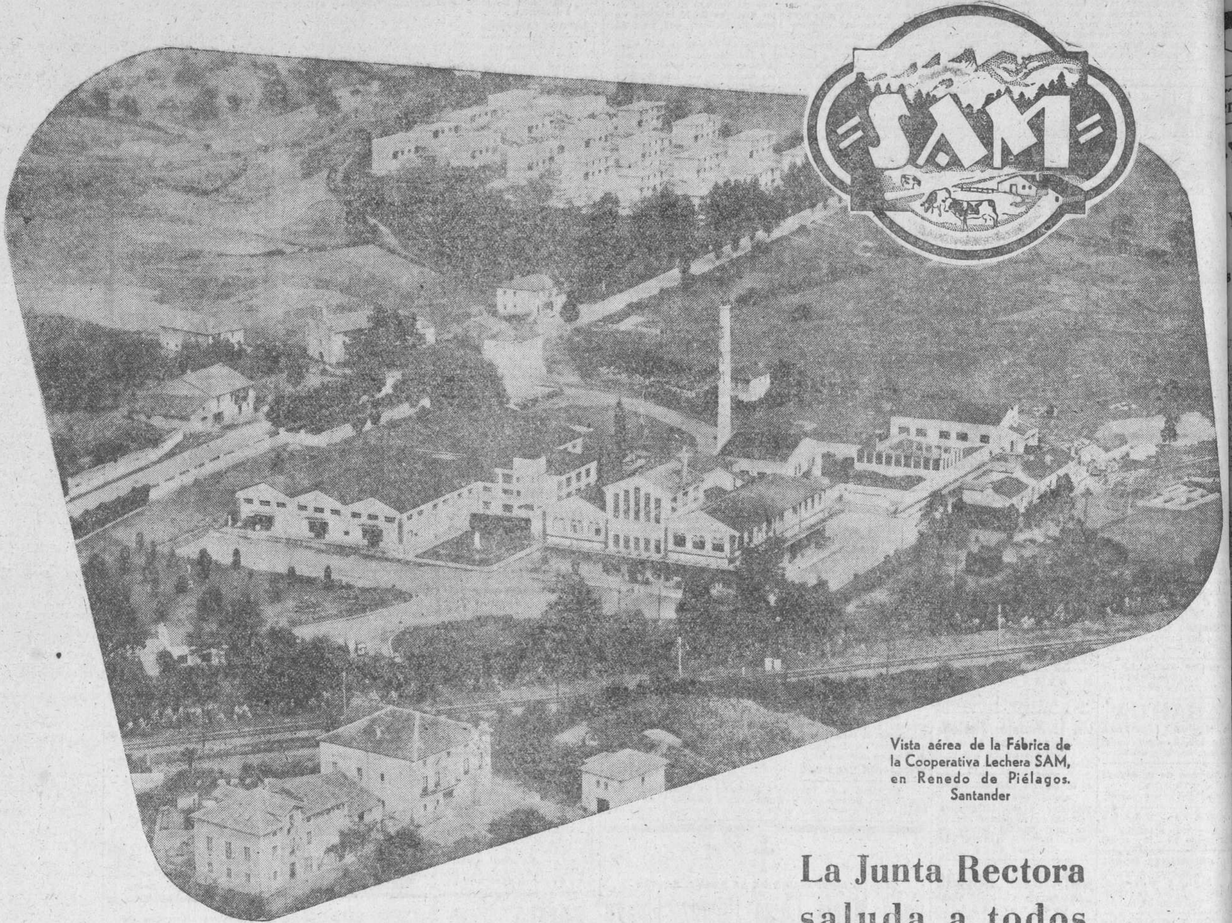
Vista aérea de la Fábrica de la Cooperativa Lechera SAM, en Renedo de Piélagos, Santander

La Junta Rectora saluda a todos sus consocios, colaboradores y clientes