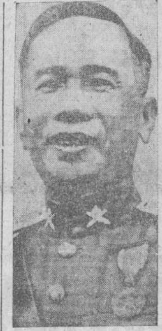
El mariscal Pibul Songgram, jefe del Gobierno de Tailandia.

Bangkok. — El jefe del Gobierno, Pibul Songgram, ha anunciado que ha formado nuevo Gobierno, después de diez días de deliberaciones y consultas.