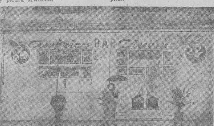
La elegante portada del "AMERICA BAR CINEMA" anima a penetrar en el suntuoso local.