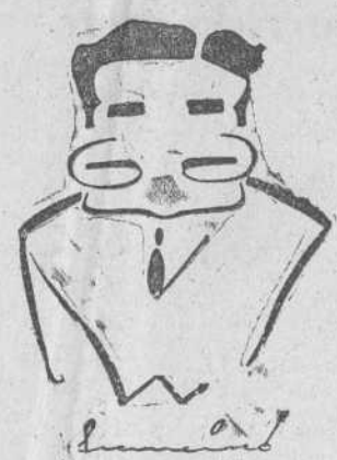
Don Víctor de la Serna, maestro de periodistas. (Visto por FRANCISCO.)

El sábado, y con todos los honores, cayó el telón de la Plaza Porticada. Treinta y dos programas de categoría internacional han pasado por su tablado. Muestras muy diversas de danza, teatro y música, fueron aplaudidas sinceramente cada noche, no por una forma externa de expresión, sino porque aquello que se oía o veía, llegaba fácilmente al sentimiento y estábamos obligados a mostrar nuestro contento y admiración. El IV Festival Internacional santanderino lo recordaremos con agrado, porque ha saturado nuestras aficiones. Y cuántas veces buscaremos en el recuerdo de estas treinta y dos noches la placidez de unas horas, verdaderos oasis en el tráfico, raudos y violentos, de cada día! Nosotros también tenemos que "bajar" el telón de nuestras entrevistas. Y para ello, nada mejor que solicitar de don Víctor de la Serna, maestro de periodistas y cronista oficial del Festival, nos conteste a unas preguntas para los lectores de la HOJA OFICIAL DEL LUNES. Don Víctor, con su proverbial amabilidad, nos habla de esta suerte: