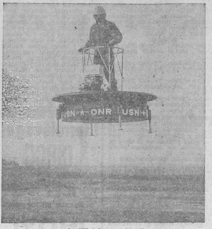
La "Plataforma volante".