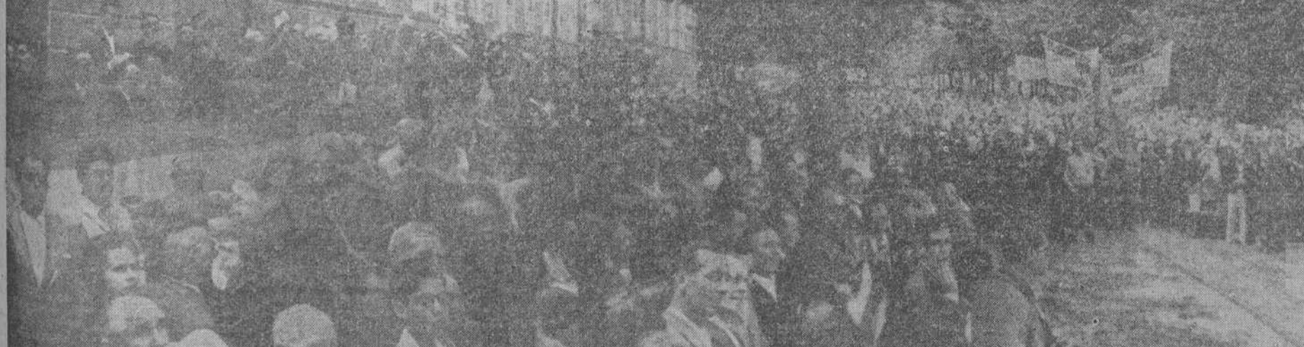
DAMOS HOY A NUESTROS LECTORES UNA PERSPECTIVA DE LA MAGNA PEREGRINACION SINDICAL DE LA QUE DIMOS, EN SU DIA, AMPLIA INFORMACION A NUESTROS LECTORES. SE TRATA DE UNA PERSPECTIVA PARCIAL, PUES UN NUMERO INGENUO DE PEREGRINOS (APARTE LOS QUE SE HALLAN ENTRE LA ARBOLEDA, Y SON INVISIBLES) HAN QUEDADO DETRAS DEL OBJETIVO FOTOGRAFICO, POR LO QUE NO APARECEN EN LA FOTO (Vean los lectores en quinta página, un trabajo de nuestro colaborador don D. Doroteo Hernández Vera, en el que desgraja enseñanzas de la grandiosa peregrinación realizada el día 11 último.)