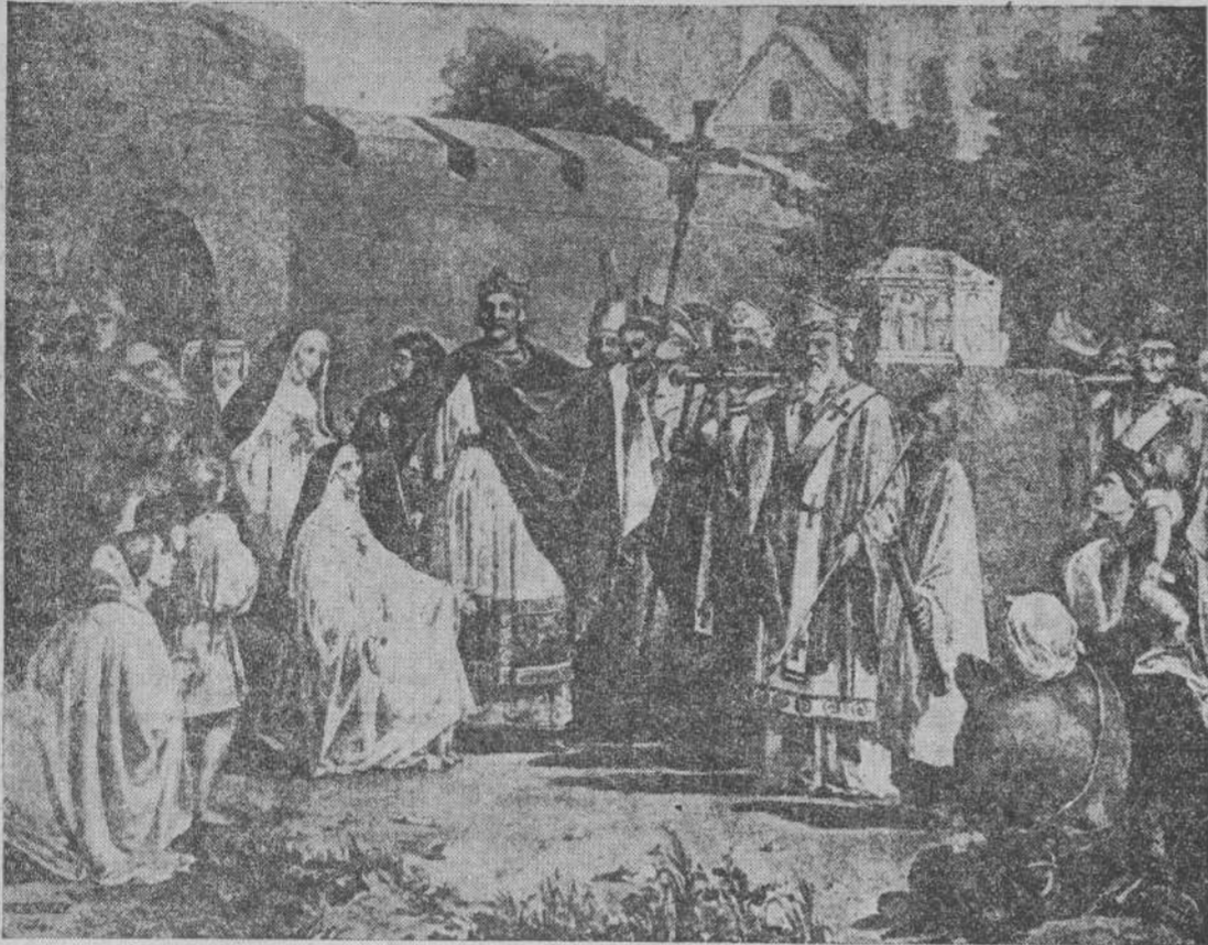
Carlomagno entrega a la preciosa Túnica inconsútil a su hija Teodrada.

Es la misma que se sortearon los soldados romanos al pie de la Cruz