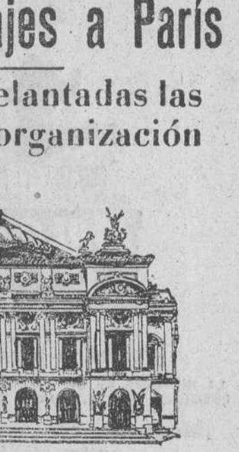
El famoso Teatro de la Ópera, de París, es una de las construcciones notables de la gran capital francesa que figura siempre en el carnet de visitas de los turistas. El grabado que acompaña a estas líneas ofrece una idea de la grandiosidad del célebre selenio.

Granada.— Pese a las nubes que han entoldado el cielo y a la lluvia de primera hora de la tarde, que ha estado brillante a la primera granadina, la animación en las calles ha sido extraordinaria desde primeras horas de la mañana. En distintos lugares del centro de la población se instalaron mesas peltoradas para recabar fondos de este extraordinario sorteo, y estamos satisfechos de las perspectivas de éxito que aquellos nos ofrecen, precisamente porque ello favorecerá al mejor resultado, a las comodidades, a las distracciones, al feliz desarrollo, en suma, de esta iniciativa de la HOJA OFICIAL DEL LUNES en obsequio de quienes con una asiduidad y un interés que jamás agradeceremos bastante, colaboran en la vida de nuestro periódico.