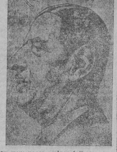
Pinay ocupa el Poder en Francia, pero todos piensan en De Gaulle. ¿Estará el general llamado a conseguir de nuevo lo que dejó en tono olímpico hace seis años?