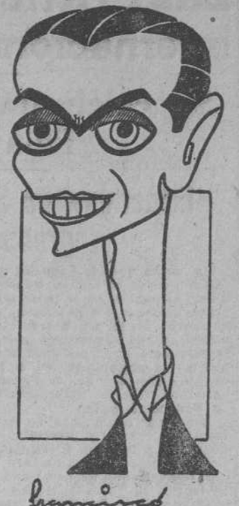
EL MAESTRO ATAUFO ARGENTA

mente para nuestra música, el carácter aventurero español pasó a la historia. En caso contrario no contaríamos con ningún músico de categoría, porque todos hubieran emigrado. —Fuera de aquí, ¿viven los compositores sinfónicos exclusivamente de lo que producen? —Desde luego, Strawinski, por ejemplo, ha cobrado un millón de pesetas por dirigir el estreno de su ópera en la Scala de Milán. —Bueno, esas son cifras excepcionales. —No lo crea. Un instrumentista destacado gana treinta, cuarenta y hasta cincuenta mil duros anuales. Un compositor, bastante más. —En fin, para terminar hablemos algo de usted. ¿Qué hace cuando no dirige? —No puedo hacer más que dirigir y ensayar. Sólo tengo tiempo para ir los domingos al fútbol. Asisto invariablemente aunque sean partidos poco interesantes. El fútbol me sirve de distracción y descanso. Se acaba la entrevista. De nuevo, el escenario para repasar el magnífico segundo tiempo del Concierto de Prokofieff. La universal batuta de Argenta dibuja en el aire la invisible gráfica de la inmaterial partitura.