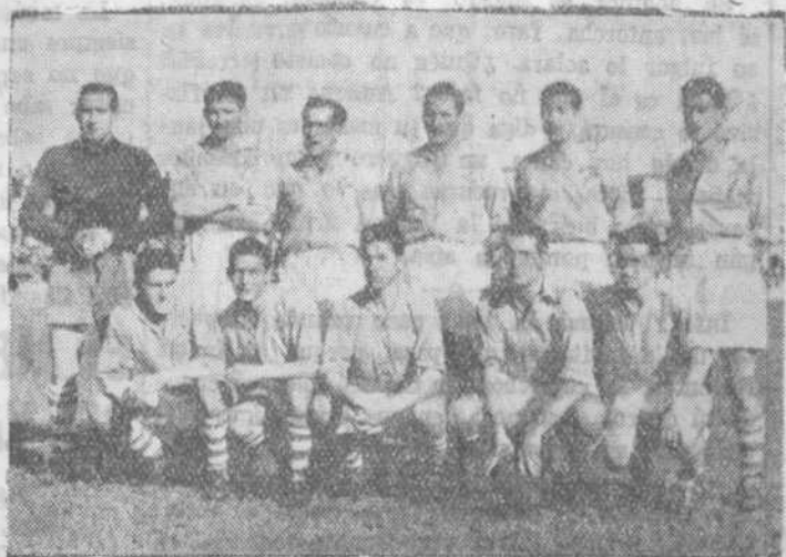
El equipo del Celta

La tarde, realmente magnífica, llevó bastante gente a El Calvario, a fin de presenciar el amistoso encuentro Celta - Salamanca. Arbitrando Arturo Santos, con Barrado y Román en las líneas, los equipos alinearon así: Celta: Marzá; Gaitos, Lolín, Cabino; Díaz y Alonso; Mekerle, Hermida Atienza, Areitio y Vázquez. En el segundo tiempo, Mekerle sustituyó a Díaz y el ala derecha la formaron Borbolla y Sobrado, mientras Saras salía en lugar de Vázquez. La U. D. Salamanca formó con Floro; Párraga, Mieza, De la Mata; Escudero y Herrero; Nano, Uceda, Lorea, Albizua y Urre.