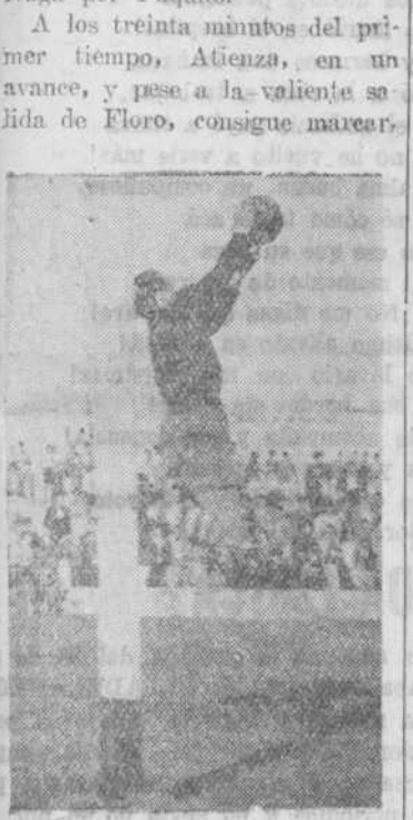
Buena parada del meta vigués

No se hizo más cambio, tras el descanso, de sustituir a Párraga por Paquito. A los treinta minutos del primer tiempo, Atienza, en un avance, y pese a la valiente salida de Floro, consigue marcar.