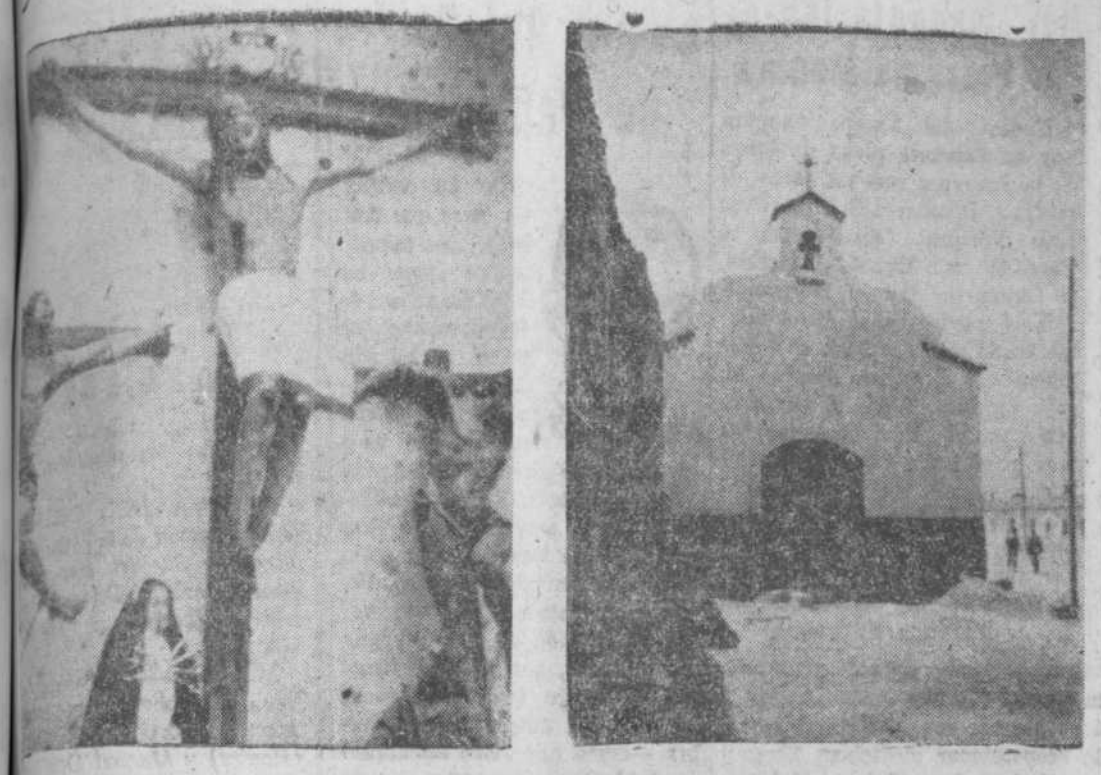
Religiosísima imagen del Cristo, que se venera en la ermita. Ermita del Santísimo Cristo del Humilladero.