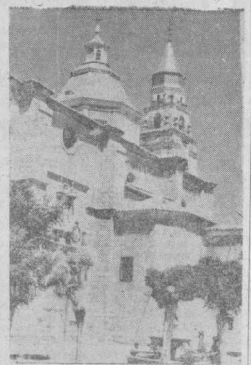
La magnífica iglesia de San Miguel, de Peñaranda de Braamonte

En fin, amigos. Siempre devotísimo. GEACHE