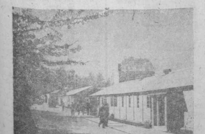
En estos importantes laboratorios se separan debidamente los elementos para evitar que las radiaciones deterioren los aparatos costosísimos más cercanos