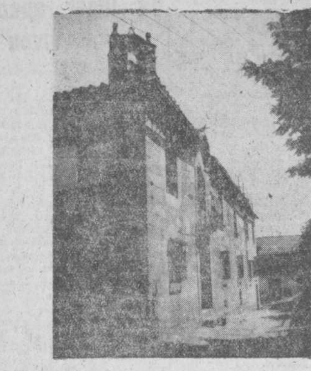
Edificio del Hospital de Santo Domingo.