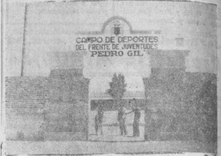
El nuevo Campo de Deportes de Peñaranda

mandades las masas obreras de cada término municipal con sus legítimas aspiraciones de mejoramiento social y laboral, que caracteriza y da vida a las representaciones sociales de estas entidades menores, sin cuya sabia se convertirían en fríos organismos económicos de tipo clasista. Esta meta ha sido alcanzada ya por algunas de dichas Hermandades, vigilando escrupulosamente el cumplimiento de