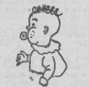
"Crupito", por Nicolás Gómez Ramos (Salamanca)