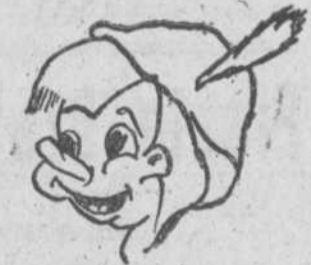
"Pinocho", por Emilio García