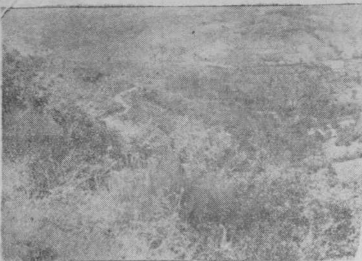
La serpenteante carretera de El Cerro a Lagunilla y los caminos a Montemayor, Valdelacasa y a Extremadura, se pierden en la amplitud de estos valles que fueron de Avila, de divisiones viejas y hoy son el límite de nuestra provincia

Cuarto de la Sierra.—Neila, San Bartolomé, Becedas, con Pa-