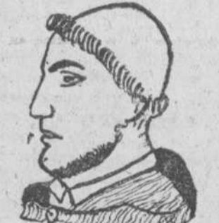
"Cianeros", por José Pérez