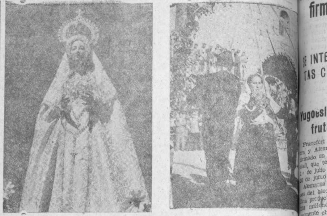
La Virgen de Caballeros, Patrona de Villavieja de Yeltes, a la izquierda, y a la derecha, los charros de aquella villa charra, tejiendo el cordón en su Plaza Mayor

La Virgen de Caballeros escuchó siempre las plearias de los hijos de Villavieja de Yel-