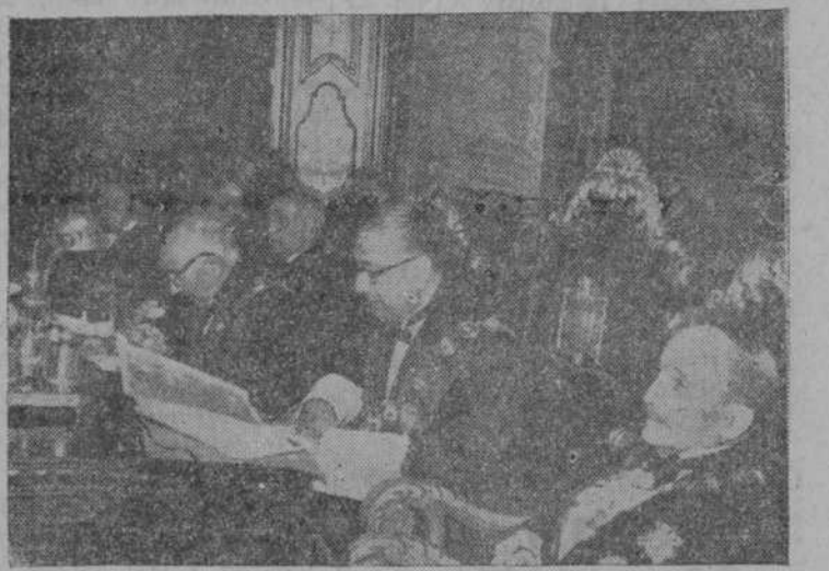
El presidente del Tribunal Supremo, señor Castán Tobeñas, pronunciando el discurso de apertura. A su izquierda, el ministro de Justicia, señor Irujo.