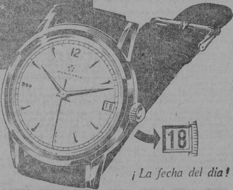
¡La fecha del día!

La fórmula Eterna-Matic de cuerda con rodamiento de bolas es tan perfecta que ha dado paso al reloj automático impermeable más pequeño del mundo: el Eterna-Matic para señora.