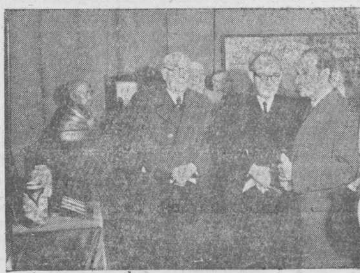
El ministro de Educación Nacional durante el acto de inauguración del XXIII Salón de Otoño, en el Museo de Arte Moderno.