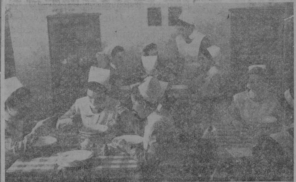
Las enfermeras de «Salus Infirmorum» en su hogar de Madrid

de poseer un centro de reunión en donde centralizar la labor y ayudar a vivir a las profesionales acogidas a la organización.