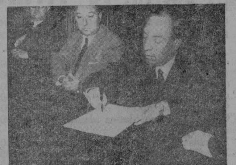
El presidente de la Diputación firmando el documento notarial