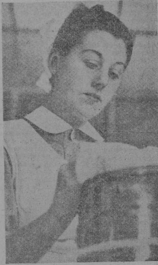
Una de las enfermeras en un momento de su tarea habitual