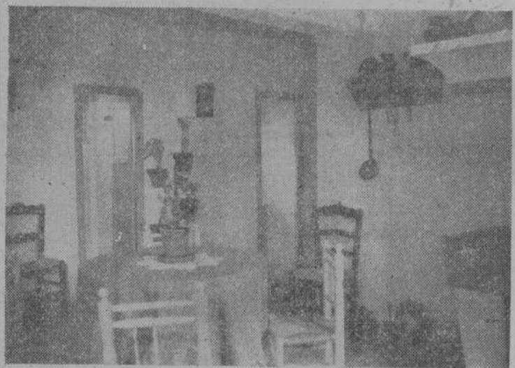
Una de las viviendas amuebladas, ofrece este grato aspecto

tra Señora de la Vega y la distancia de sus viviendas, admirable, como su construcción sólida y todo el cúmulo de detalles que se han cuidado en la realización. Y en cuanto a su lejanía, ésta es relativa, por cuanto uno de sus extremos está inmediato a las actuales edificaciones del Arrabal, y por el otro no se separa sino desde el Puente Nuevo al Romano, por la carretera que sube a este barrio, no alargará más que unos pocos metros su trayecto y llegará hasta el mismo barrio nuevo de que nos ocupamos. Lo mismo a la ida que a la vuelta, hemos visto cómo la obra de la barriada se prolonga hasta la Puerta de San Pa-