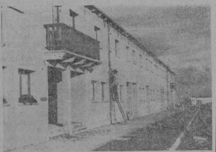
Se dan los últimos toques a estos bloques de las nuevas viviendas, que quedarán terminados en esta semana

sa que sirva de ayuda a la economía hogareña. En el centro de la barriada de Nuestra Señora de la Vega se encuentra una encantadora Plaza Mayor, con soportales y dos plantas. Arriba serán viviendas como las restantes, y abajo se ha dispuesto una buena cantidad de locales para tiendas, capaces para llenar todas las necesidades de este vecindario. Sus fachadas están realizadas a imitación de las del Palacio de San Boal, con amplios balconajes, todo en un estilo muy salmantino, de forma que el conjunto amplio, abierto en la parte del Mediodía al campo y teniendo