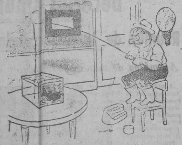
—¡Mira que no querer picar, sabiendo que lo vuelve a echar al agua!