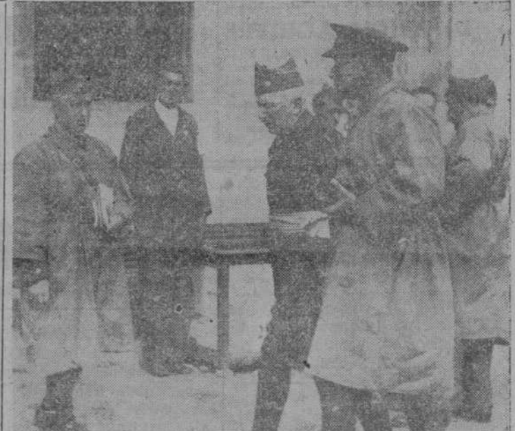
El general Mola pasea con el coronel Montaner mientras llegan los restantes miembros de la Junta de Defensa Nacional. Al fondo, a la derecha, el general Saliquet; a la izquierda, el teniente coronel de Estado Mayor señor Urquiza. Eran las diez de la mañana del 21 de septiembre de 1936.

La recepción oficial en conmemoración del XVII Aniversario de la exaltación de Caudillo a la Jefatura del Estado, tendrá lugar, hoy, a las doce de la mañana, en el Gobierno civil, y el desfile se seguirá con arreglo al orden que publicábamos en nuestro número de ayer.