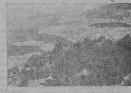
Vista de La Guardia desde el Tecla

El circuito Vigo - Bayona La Guardia - Tuy, es uno de los más bellos de Galicia. Que ya es decir. Lo hacen constantemente las modernas empresas de turismo colectivo y lo hacen los afortunados que tienen buen gusto y un coche; o buenos amigos, como en este caso, que facilitan a uno tan fácil excursión.