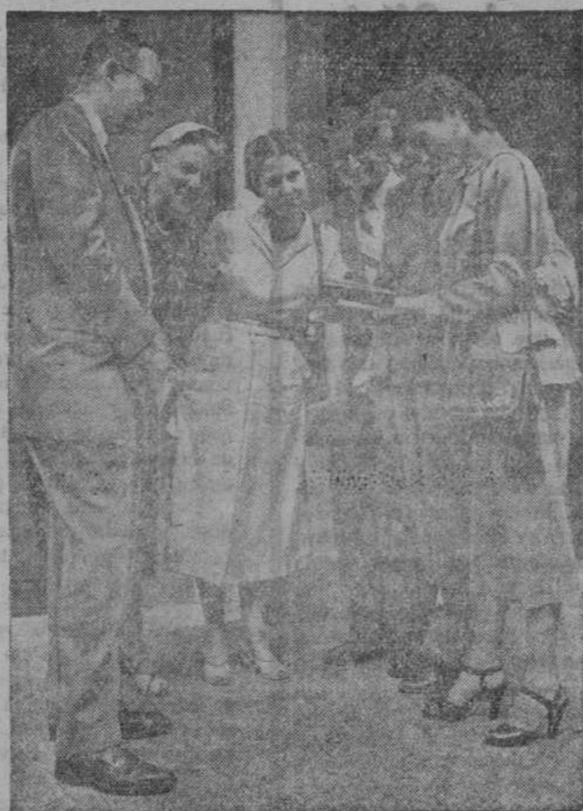
He aquí a un grupo de profesores estadounidenses que realizan un viaje por Europa. La fotografía está obtenida durante su visita a la capital londinense