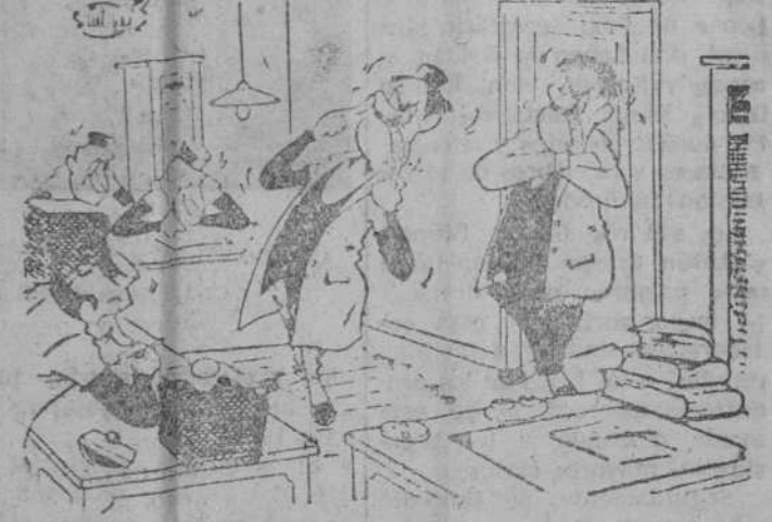
—¡Fijaros qué bien imito al patrón cuando viene a echarnos una bronca!