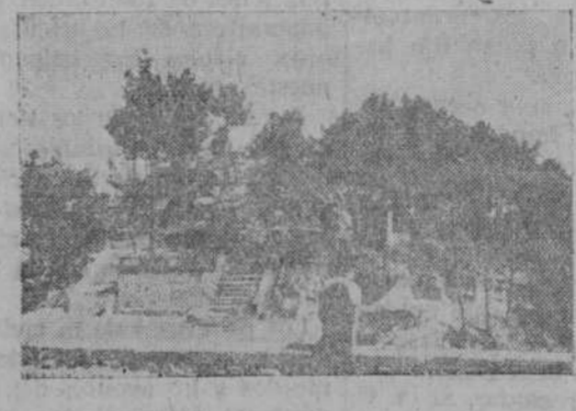
Monte de Santa Tecla