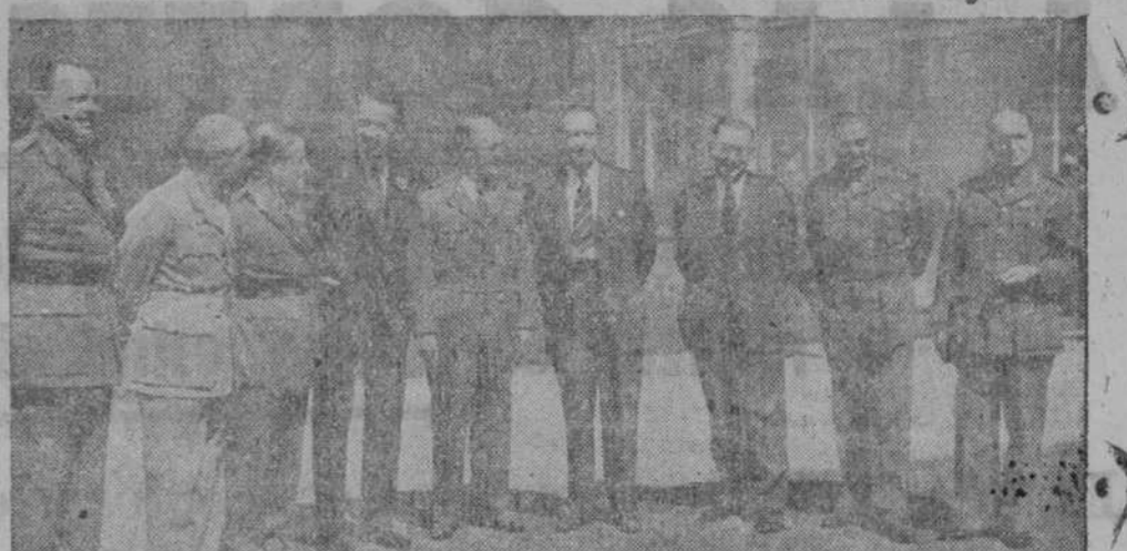
Grupo de autoridades militares de Gran Bretaña y países de la Commonwealth, que se han reunido en Camberley para discutir algunos importantes problemas relacionados con las armas atómicas