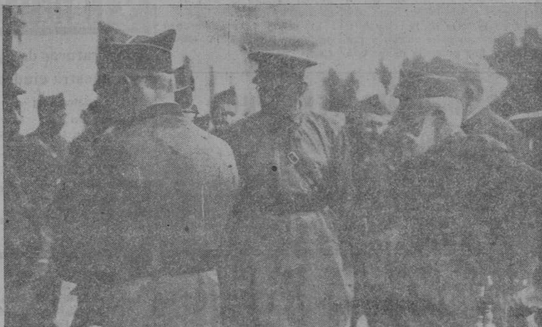
Los generales Cabanellas, Mola, Valdés Cavanilles y Dávila, con otros miembros de la Junta de Defensa Nacional, se reunieron, en la mañana del 21 de septiembre de 1936, en el patio del cuartel de Caballería de Calatrava, desde donde marcharon a los campos salmantinos de San Fernando.

No tendría tanto mérito esta obra nuestra, si hubiese (Continúa en 4.ª página)