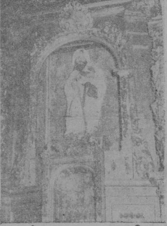
En el mismo lugar que ocupaba, en los campos de Muñodono, el barracón que albergó a la Junta de Defensa Nacional en su reunión histórica para la elevación del general Franco a la más alta magistratura del Estado, ha sido levantada la ermita del Caudillo, con el monolito conmemorativo, que aparece también en la foto de la izquierda; a la derecha, el retablo de la ermita, con la imagen de Santiago Apóstol.