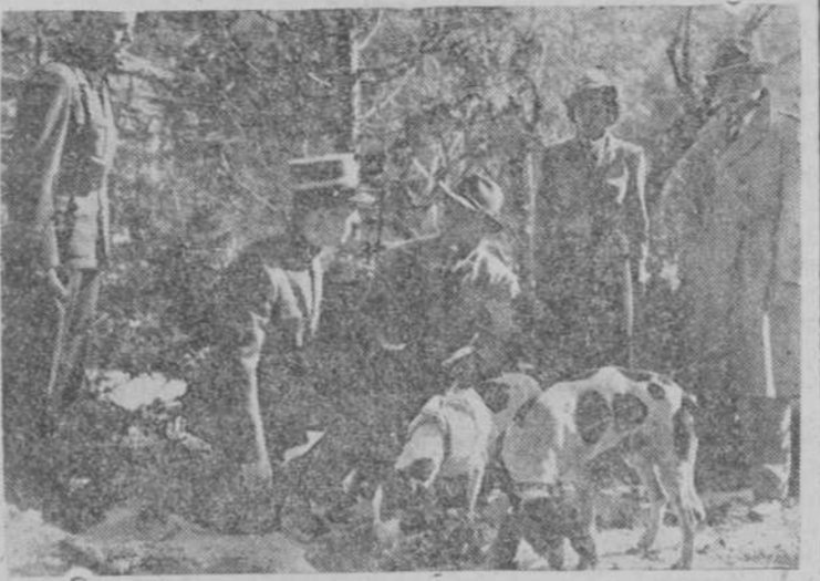
Una emocionante escena de la película "Contraespionaje", de Universal-International, de la que son principales intérpretes María Toren y Howard Duff. "Contraespionaje" es un intenso drama en el que seis hombres y una mujer se juegan la vida para apoderarse de un cierto secreto de Estado.