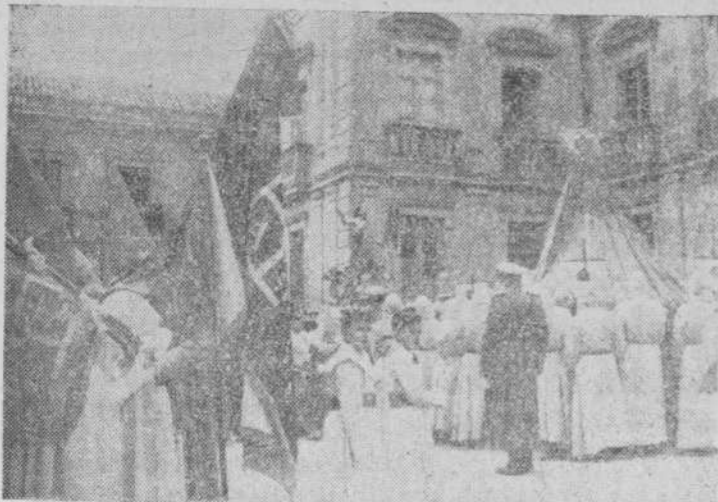
Momento de "El encuentro", en la Plaza Episcopal