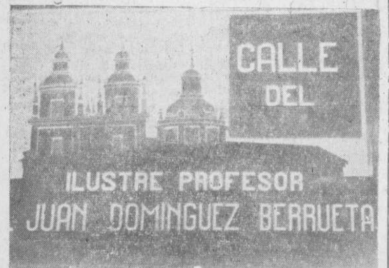
Placa inaugurada ayer en la travesía de San Francisco

ble pone en sus hijos todo su amor y sacrificio y se siente orgullosa cuando aquellos realizan cualquier acto de bondad, virtud o suficiencia. Este