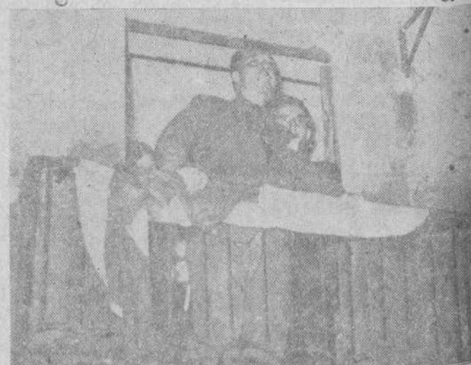
El gobernador civil dirigiendo la palabra al vecindario de Aldearrubia

Ciudad del Vaticano.—Su Santidad el Papa Pío XII ha salido en automóvil esta tarde para su residencia de verano de Castelgandolfo, donde pasará unos meses de vacaciones. La caravana pontificia estaba formada por cuatro coches. Su Santidad ocupaba el segundo. En el primero iba el comandante de la Guardia pontificia y en el tercero el príncipe Pacelli y el médico del Padre Santo, Galea Zigijsi. El cuarto coche pertenecía a la Policía italiana. (Efe.)