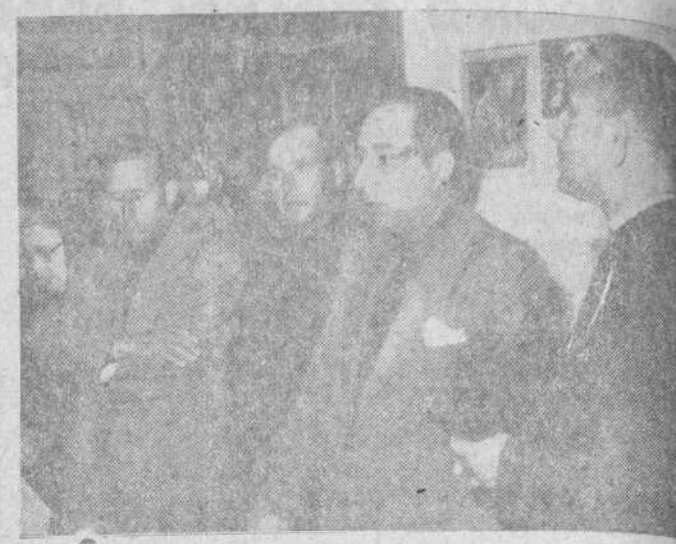
Momento del discurso en la entrega de títulos en Forfoleda.