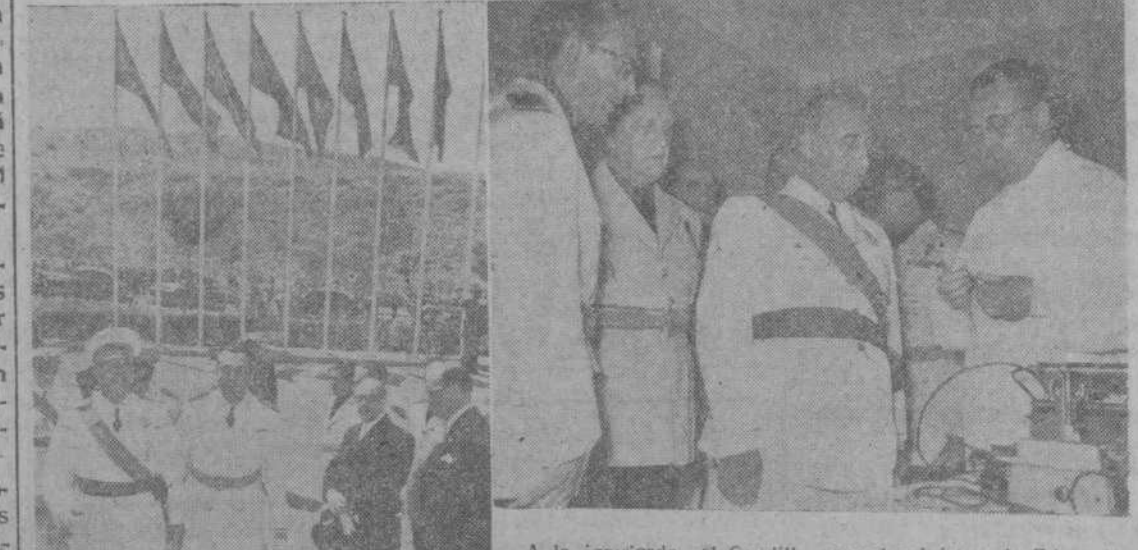
A la izquierda, el Caudillo con el ministro de Educación Nacional en la Ciudad Universitaria, al inaugurar los nuevos locales del Instituto Nacional de Medicina y Seguridad en el trabajo.—A la derecha, el Jefe del Estado escuchando la explicación de uno de los doctores sobre los modernos aparatos que ha sido dotado el nuevo sanatorio de la Obra del 18 de Julio