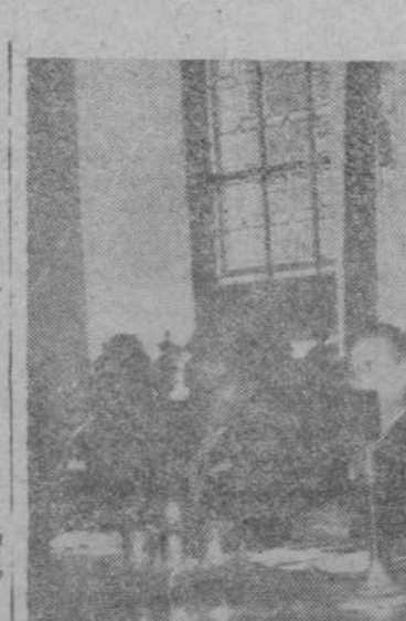
El doctor Cavaleiro de Ferreira, ministro portugués de Justicia, durante su magistral disertación