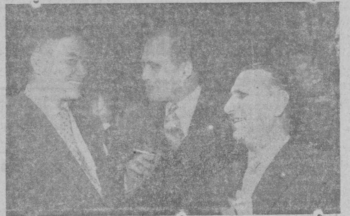
Los ministros de Justicia de Filipinas, Portugal y España