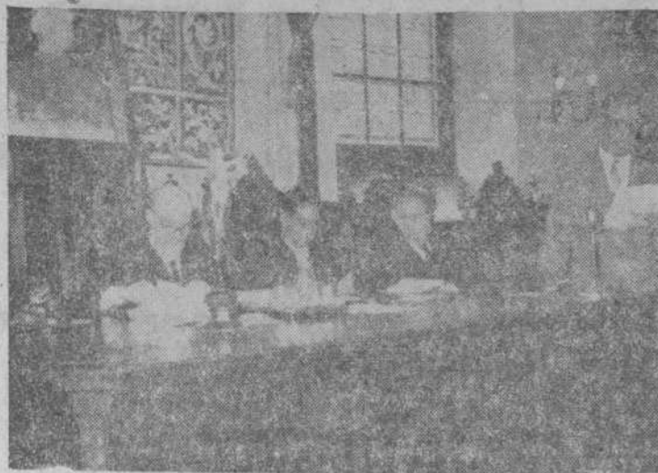
Presidencia de la última sesión de trabajo del Congreso