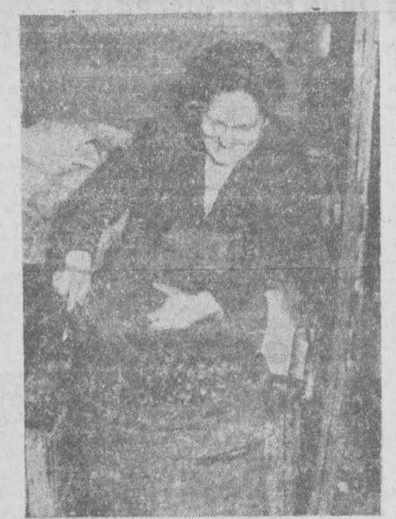
«¡Caleñtitas caleñtitas...!» Una vuelta más al asador y las castañas estarán en su punto. «¿Quién las quiere?»

el veto a la discusión y el romance se iniciará con toda suavidad.