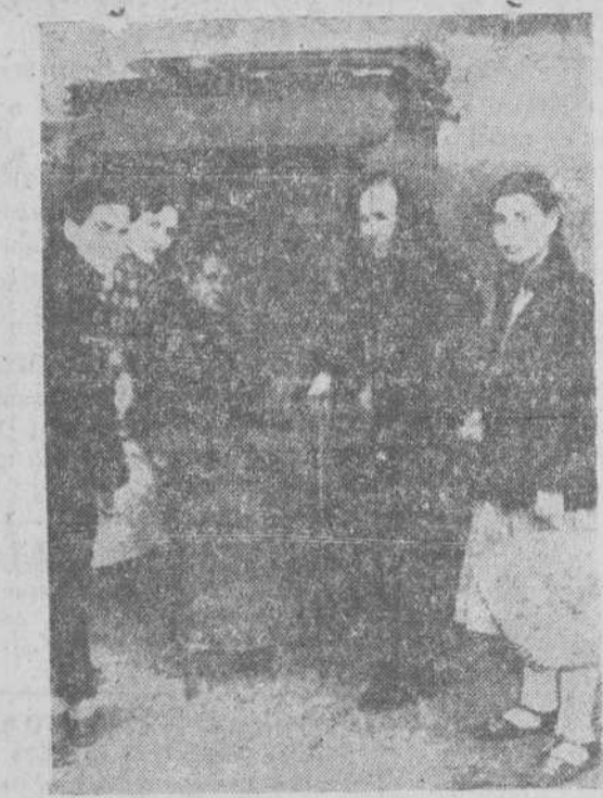
Una escena bien corriente. La castañera rodeada de amigas y vecinas espera la llegada de los clientes. Mientras tanto se comenta el suceso y la noticia del día

HOTEL ITALIA TODO CONFORT Director y propietario, ELIOT GUTIERREZ. Avenida de José Antonio, núm. 30 (entradas por Giménez de Quevedo). MADRID. Teléfono 224790