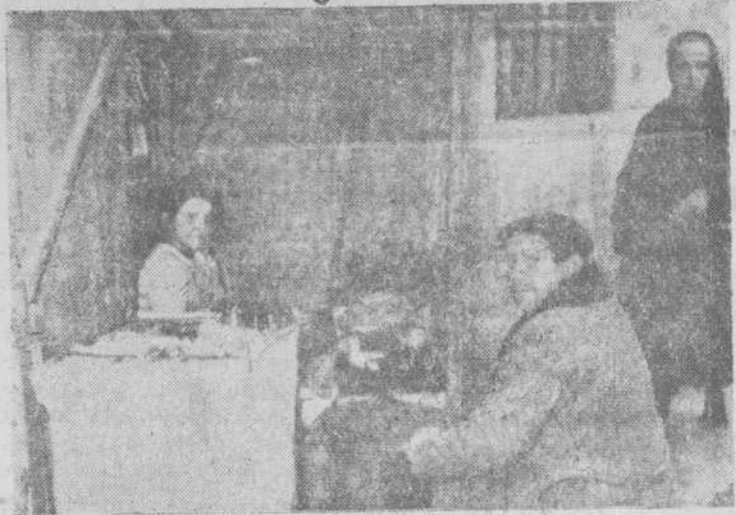
Esta vez el personaje central —la castañera— se marchó y en su lugar dejó a la pequeña. El padre vigila atentamente los movimientos de la niña.

—¡Hola, Alberto! Mira; te he comprado castañas asadas. —Están buenas. Se agradecen. Ayer no me llamaste por teléfono ¿Qué te pasó? —Bueno, no empuces. Toma como esta que es bien gordita... Y así, la castaña asada pone