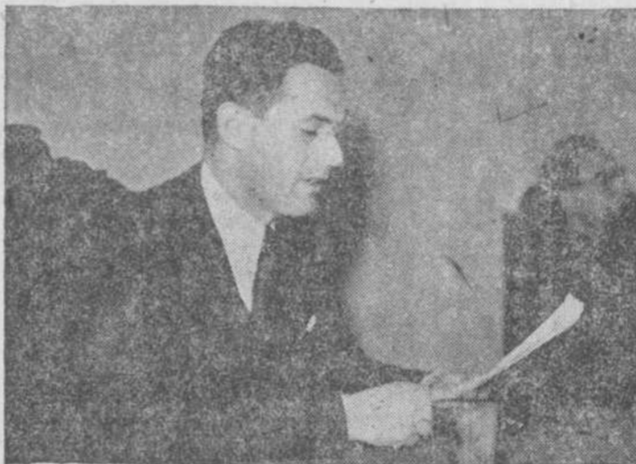
El profesor George Uscatescu, pronunciando su conferencia

Hace luego un examen de los principios del Derecho consuetudinario rumo, "costumbre de la tierra" y sus repercusiones en el derecho positivo. Distingue el autor cuatro etapas fundamentales en la evolución de las formas jurídicas en Rumania, la etapa propiamente "rumana", que corre desde el siglo II hasta el siglo XIV; la segunda etapa, que se resiente por los influjos de la legislación eslavo-bizantina siglos XIV-XVII; la tercera etapa, caracterizada por el recrudescimiento de la cultura bizantina en los Principados después de la caída de Constantinopla, celebrada en las legislaciones de los