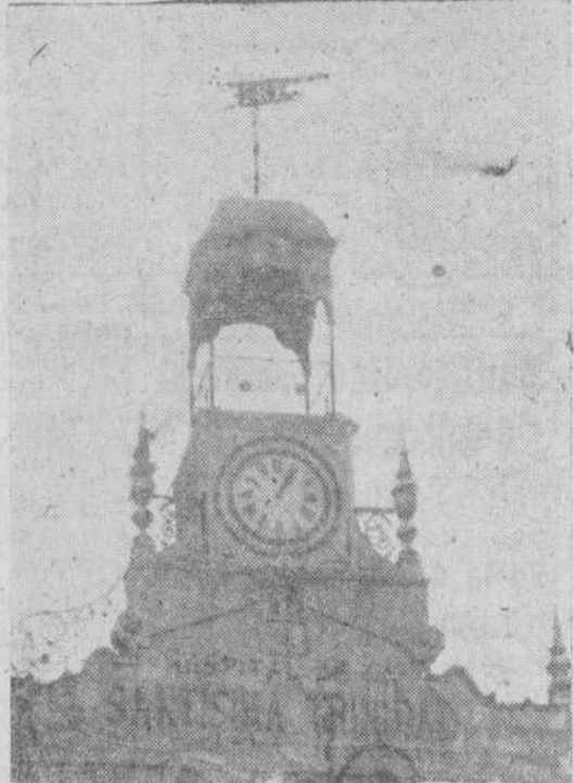
En la elevada torreta del Hospital de la Santísima Trinidad está el popular reloj, que cumple ahora los cuarenta y cuatro años