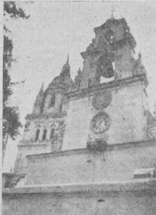
Una estampa inolvidable para el estudiante universitario es esta del campanario, junto al árbol de las calabazas, y la torre de la Catedral

Más hoy que el de la Plaza, el universitario, el catedralicio, el