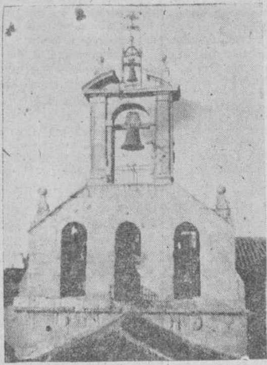
El campanario de San Martín, único aspecto externo del reloj, que en tiempos no tuvo rival en la ciudad