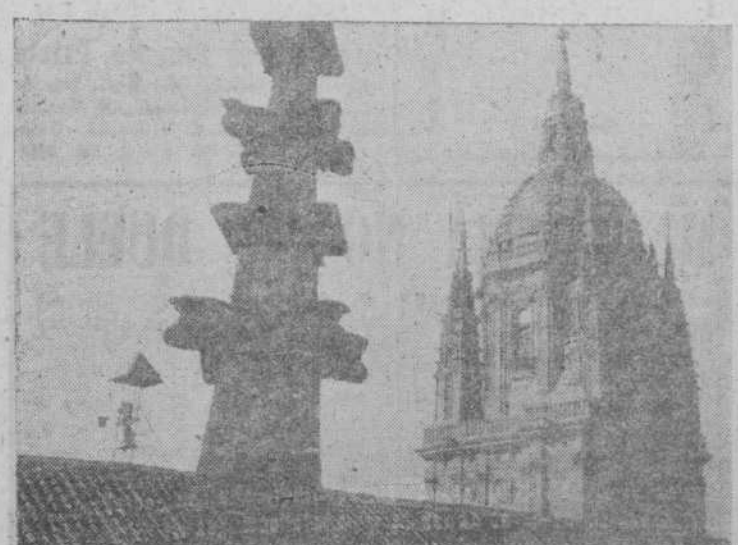
El cimbalillo, antiguo portavoz de horas propicias a la reunión, aparece aquí en segundo plano, y al fondo la torre de la Catedral con sus antiguas esferas de relojes que ya no funcionan.