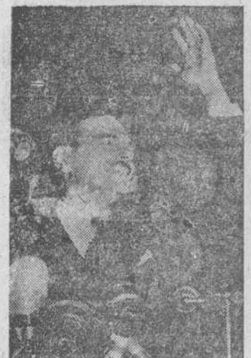
Thomas Dewey, que ha sido elegido candidato oficial del partido republicano para la Presidencia de los Estados Unidos