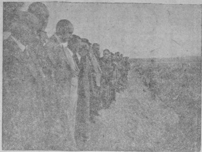
Las autoridades salmantinas, sobre las tierras en que se ha abierto la larga acequia, contemplan la magnitud de la obra.