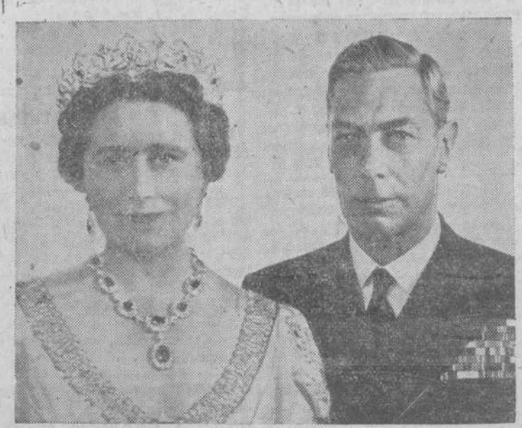
Fotografía de SS. MM. el rey Jorge VI y la reina Isabel, tomada especialmente para conmemorar el 25 aniversario de su matrimonio, que se ha cumplido el pasado día 26 de abril.