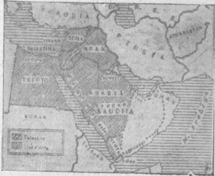
Mapa del cercano oriente, en el que destaca la pequeña superficie de Palestina rodeada por los inmensos Estados árabes: Siria, Irak, Arabia Saudita y Egipto

Jerusalén.—Las fuerzas árabes han atacado Mekor Hayim, en suroeste de Jerusalén, con intenso fuego de armas automáticas, pero fueron rechazadas. La Policía y el Ejército británicos no intervinieron, porque Mekor Hayim se encuentra fuera de la zona de Jerusalén, donde se ha dado la orden de alto el fuego, por Sir Henry Gurney, amonazado con lanzar las fuerzas británicas contra cualquiera de los dos bandos que avanzan desde las posiciones donde se encuentran reanuden las hostilidades. En algunos barrios se han oído disparos esta mañana. La ciudad de Jerusalén está azotada por un viento cálido y seco del Desierto, que causa trastornos, debido a la escasez de agua. (Efe.)