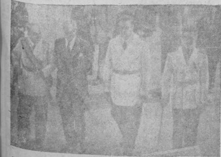
Don Esteban Bilbao, presidente de las Cortes, y el ministro de Asuntos Exteriores, señor Martín Ariza, presidente, con las autoridades guipuzcoanas, la procesión de San Ignacio, en el IV Centenario de los ejercicios espirituales.