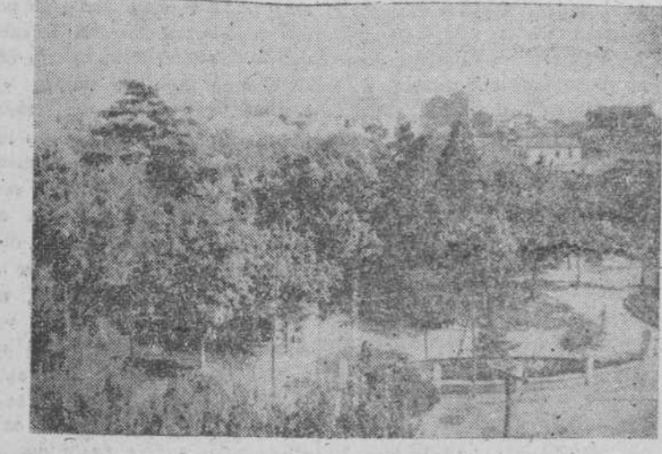
Aquí cerca parece un frondoso bosque, pero en un horizonte cercano limitando las edificaciones por donde no las polvorientas carreteras: Es nuestro parque de La Alameda.