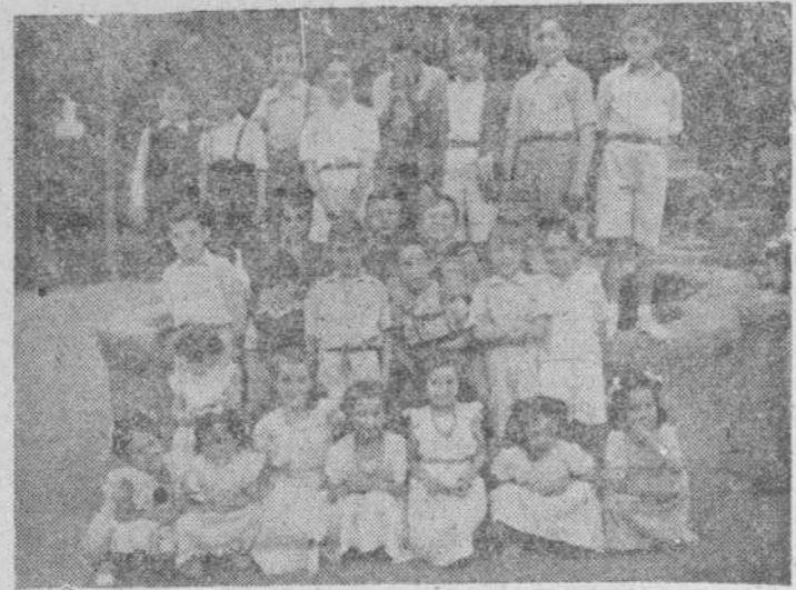
Grupo de verdaderos niños y niñas, cotidianos residentes en la Plaza de los Bandos, donde cada tarde respiran el polvo y reclaman la arena limpia de nuestro Tormes.

Muchas veces, en las tardes de este verano, hemos pensado en escribir estas líneas, con el solo ánimo de potenciar la observación general de las madres de tantos niños como en nuestra ciudad tienen que refugiarse en la Alameda, las Carmelitas, los jardines de la Glorieta, las inmediaciones de la Plaza de Toros, la Plaza de Colón y esas dos plazas cercanas a la Mayor: la de Onésimo Redondo y la de los Bandos. Allí refugianse cuantos por diversas causas no pueden llevar los chicos a La Toja, a la playa o a la sierra y cuantos por falta de nuestro parque no tienen otro remedio.