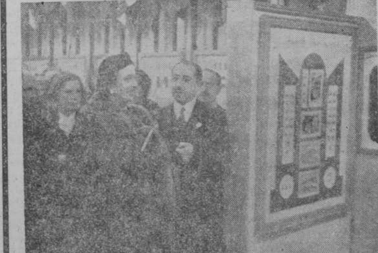
La excelentísima señora doña Carmen Polo de Franco, acompañada del director general de Correos, señor Rodríguez Miguel, durante la visita efectuada a la Exposición Filatélica instalada en el Palacio de Comunicaciones.