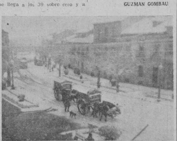
Uno de los días de nieve que registra la Estadística en 1946, en que sólo nevó siete días, fue este 15 de diciembre en que la ciudad se vistió de blanco.

EL FERMOMETRO Otra costia es el termómetro, cuyas oscilaciones registramos exactamente los salmantinos todos.