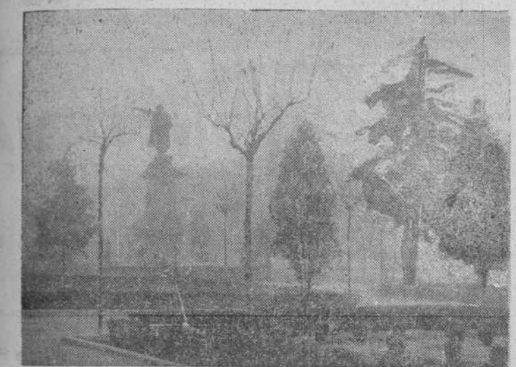
Los días de niebla van incluidos en los de cielo cubierto, pero del centenar de estos los de niebla forman un grupo de unos 40 al año...