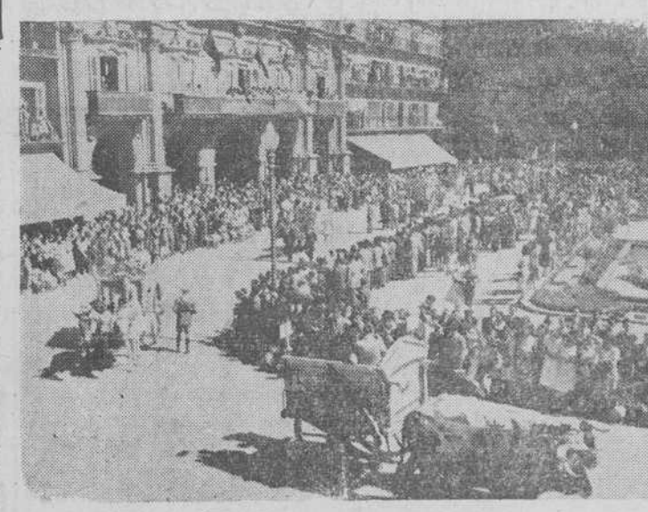
Un aspecto de la Plaza Mayor durante el desfile de carros de labranza.