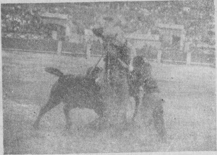
Un momento de la brava pelea de 'Sortijero'