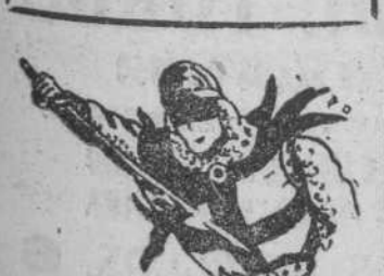
"El guerrero del antifaz", por Celestino Ingelmo.

"Éstos (se refiere a los navegantes aventureros), generalmente, llevan a feliz término su empresa, a menos que algún incidente imprevisto no los haga desaparecer. Pero por lo menos no han dejado nada al azar".