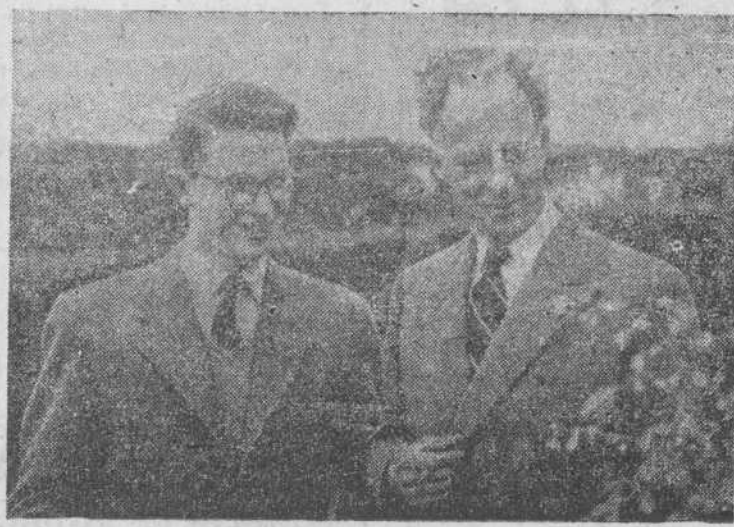
El rey Leopoldo III y su hijo, el príncipe Balduino

príncipe heredero, Balduino, acompañado del secretario adjunto del Rey, Weemas. El Monarca estrechó la mano del príncipe Amury de Merode, y de los tres ministros, que se inclinaron ante el Soberano.