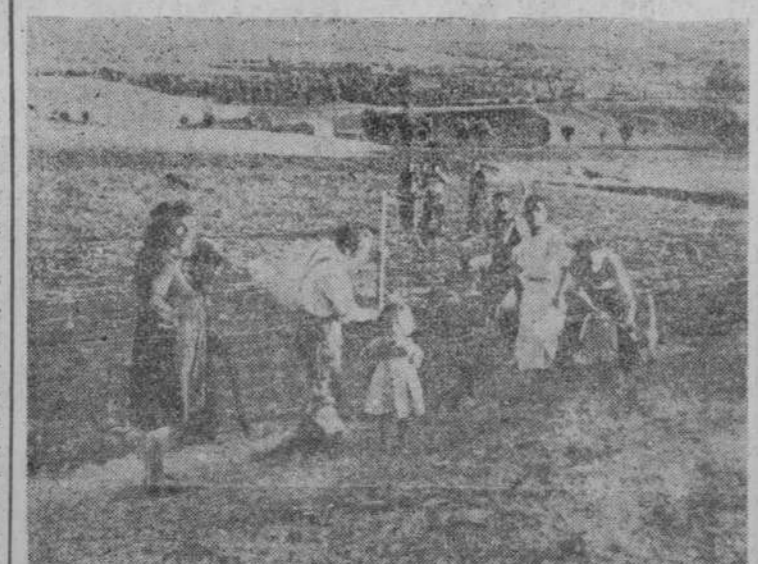
Los primeros trabajos de la futura vivienda los realiza este beneficiario de ellas, acompañado por sus familiares.