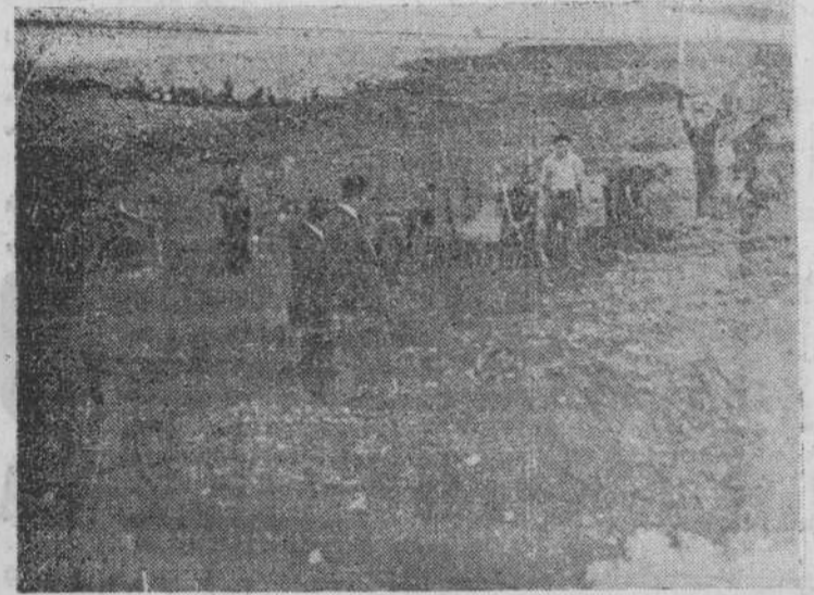
Una de las brigadas, que han comenzado, en coordinado trabajo, el trazado de las nuevas 230 viviendas de Los Pizarrales.

Si a todo esto añadimos que ya está terminado casi el centro que ha construido en las inmediaciones la Caja de Ahorros y Monte de Piedad, en donde la guardería infantil será una excelente colaboración para las familias del barrio y donde las jóvenes del mismo recibirán enseñanzas de costuras, bordados y también de cultura general, veremos que el panorama del problema pavoroso de los Pizarrales —aquel barrio surgido